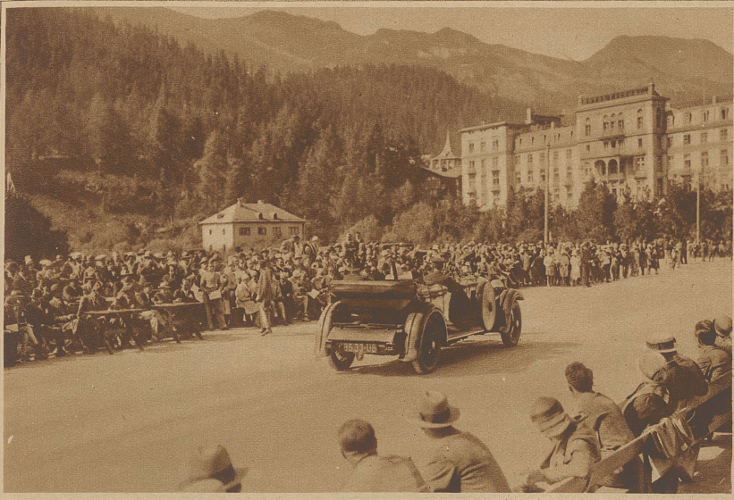
Vorbeifahrt vor der Jury und dem zahlreichen Publikum