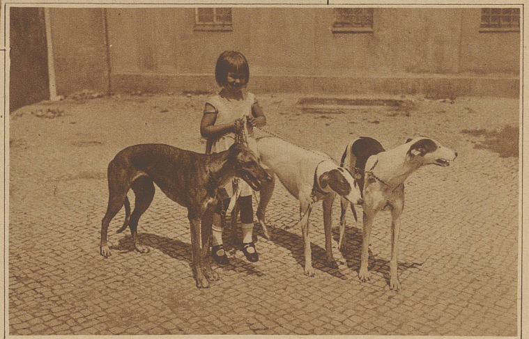
Drei in Zürich startende Favoriten mit ihrer jungen Freundin