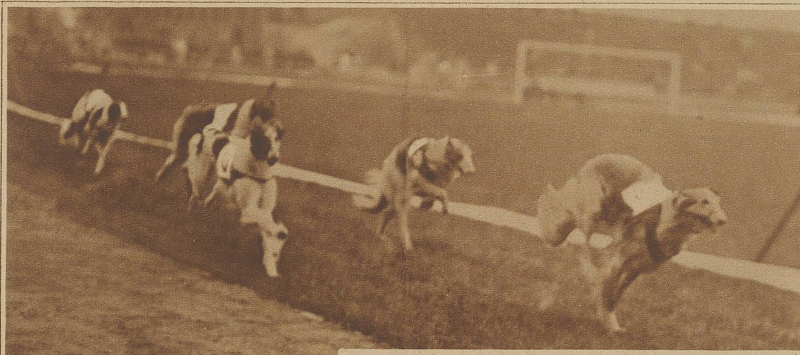
Samstag und Sonntag führt nun der Schweiz. Windhund-Rennverein in Zürich die erste derartige Veranstaltung in der Schweiz durch

Vor etwa zwei Jahren sind diese Rennen zuerst in Amerika und England und diesen Sommer auch auf dem Kontinent große Mode geworden. / Nächsten