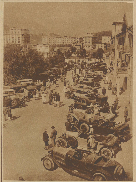
Ein Teil des Wagenparkes in St. Moritz-Bad

Schönheitskonkurrenz für Automobile in St. Moritz