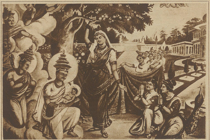
Ein interessantes religiöses Gemälde aus einem tibetischen Kloster, das in eigenartiger Form die Anbetung Jesus darstellt. Man beachte die Vermischung von tibetischen und Renaissance-motiven

Ganz orientalische Formensprache findet man dann etwa bei den Tempelbauten mit