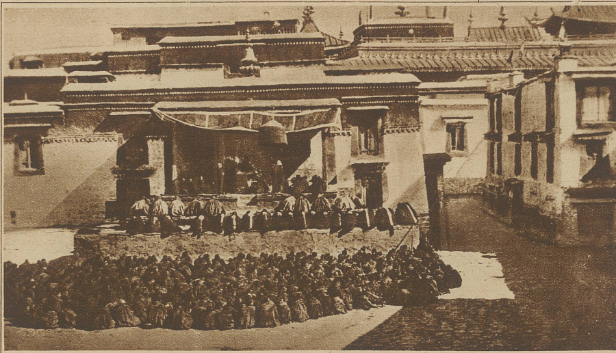
Bettelnde Pilger im Hofe des großen Klosters Bantschin-Bogdo