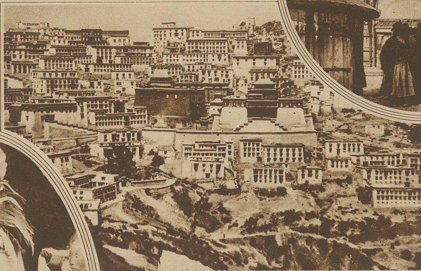
Die Klosterbergstadt, wo sich der Hauptsitz des Dalai-Lama befindet

der schiffbauartigen Giebelgliederung. Oder auch wieder in der Kleidung. Sind schon die Gewänder der Lama von großem Reichtum, so sind die des Dalai-Lama von geradezu erdrückender Prunkhaftigkeit. Dadurch