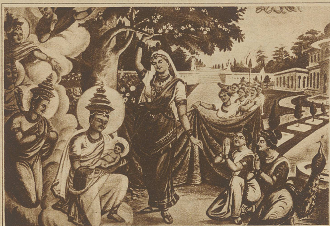
Ein interessantes religiöses Gemälde aus einem tibetischen Kloster, das in eigenartiger Form die Anbetung Jesus darstellt. Man beachte die Vermischung von tibetischen und Renaissancecismotiven

Ganz orientalische Formensprache findet man dann etwa bei den Tempelbauten mit