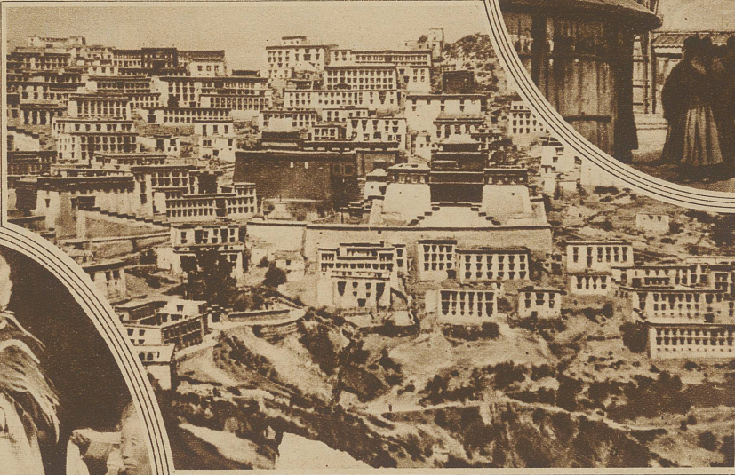
Die Klosterbergstadt, wo sich der Hauptsitz des Dalai-Lama befindet

der schiffbauartigen Giebelgliederung. Oder auch wieder in der Kleidung. Sind schon die Gewänder der Lama von großem Reichtum, so sind die des Dalai-Lama von geradezu erdrückender Prunkhaftigkeit. Dadurch