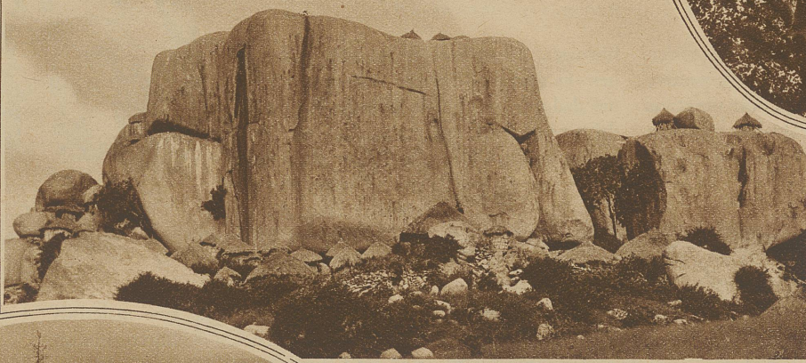
Eigenartige Negersiedlung in Uimbiti in Ostafrika. Wie Pilze einen Baumstamm, so umsäumen die Hütten den Fuß des Felsens. Die vornehmen Stammesangehörigen haben ihre Wohnstätte oben auf den Felsblöcken aufgebaut

Häuschen sind nach einer Front orientiert und haben trotz ihrer Einstöckigkeit Giebelform. Dabei fällt auf, daß die Türen nicht bis auf