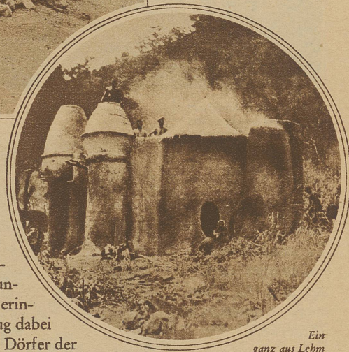
Ein ganz aus Lehm gebautes Wohnhaus der Sombas

In den Philippinen unterscheiden sich die Häuschen, was den Standort und die Primitivität betrifft, kaum von unsern, in Bäumen angebrachten Vogelhäuschen. Mit rohen Rundholzpfählen wird eine feste und flache Unterlage geschaffen, auf die das ganz im Geäst der Bäume stehende Häuschen gestellt wird. / Im alten Tunis herrschte die Felsenwohnung vor. In steilabfal-