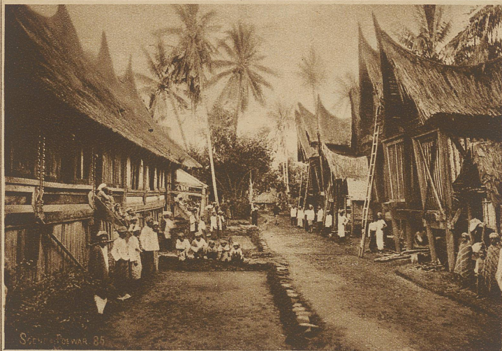
Dorfstraße im Hochlande von Padang an der Westküste Sumatras. Auf der linken Seite stehen die Wohnhäuser, auf der rechten die Reisscheunen

ermöglicht. Damit verwandt sind die kaukasischen Felsenwohnungen, nur findet man hier schon mehr eigentliches Mauerwerk.