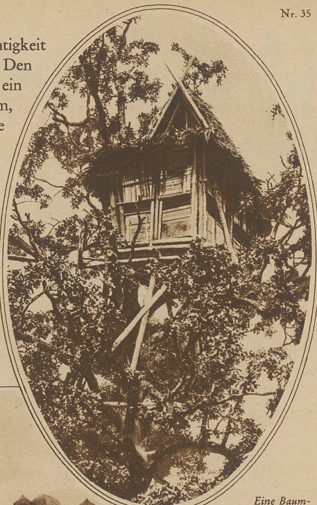
Eine Baumwohnung, wie man sie auf den Philippinen häufig sieht

fahren der Feuchtigkeit geschützt wird. Den Hauptteil bildet ein breitflächiger Turm, an den sich mehrere kleinere anfügen. Die einzige Öffnung ist der kleine, roh ausgesparte Eingang. Wiederum die Verbindung von Ton und Stroh findet man bei den Bewohnern vom Bismarckarchipel, aber diese