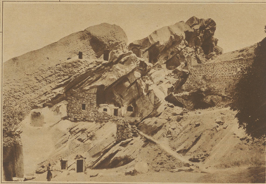
Kaukasische Felsenwohnungen in der Nähe von Tiflis

länder wieder, oder bei den Eingeborenen von West- und Ost-Afrika und in gepflegterer Form in Samoa, wo das schön gewölbte Strohdach auf festen, freistehenden Pfählen ruht.