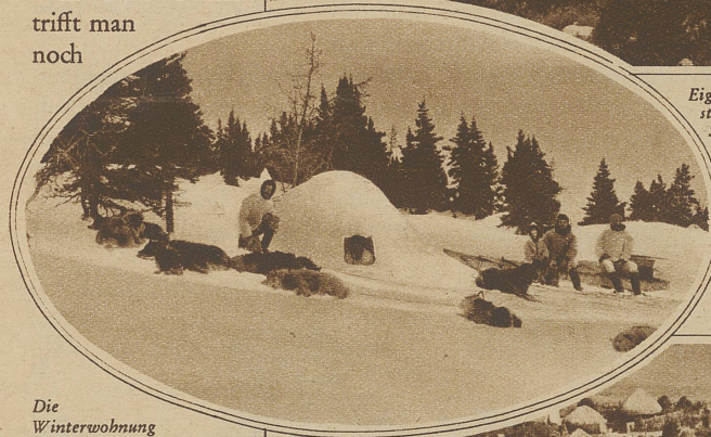
Die Winterwohnung grönländischer Nomaden

jene Bauart, die unsere Vorfahren in seereichen Gegenden pflegten: Pfahlbauten. Ganze kleine Dörfer befinden sich auf dem Wasser und sind durch primitive, mit verstellbaren Leitern beginnende Brücken mit dem Festland verbunden.