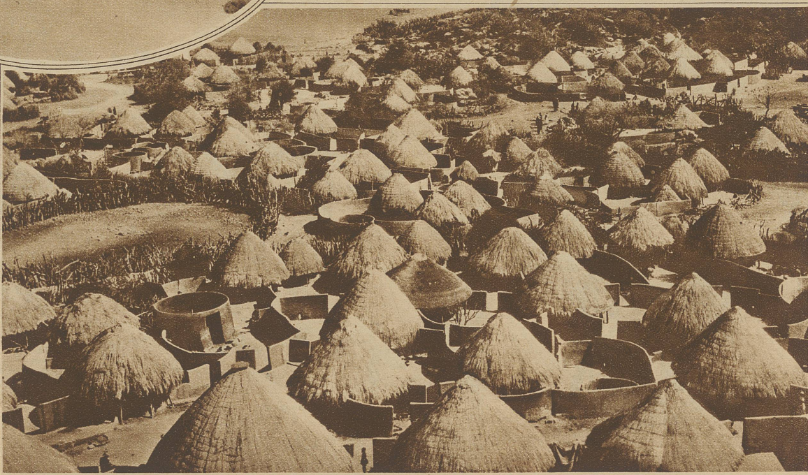
Eine typische Kaffernniederlassung. Jede Hütte ist mit einer Lehm-mauer umgeben, wie die Hütten selber auch aus Lehm gebaut und mit Stroh und Schilf bedeckt sind

An unsere Schuppen erinnern die Bretterhäuser der Eskimos und an die Unterschlupfhütten in den Bergen die Behausungen der Indianer am Paljenan-See oder der Bewohner von Langenstein bei Halberstadt.