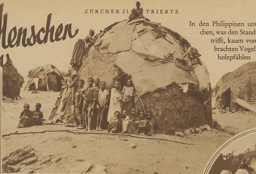
Hereros beim Pontokbau

Ueber unsere häuslichen Verhältnisse sind wir so ziemlich orientiert und wir wissen auch, daß die moderne Architektur nach einer Standardisierung in dieser Frage trachtet. Das ist nur für uns etwas Neues, die wir auf eine Ueberkultur im Wohnungswesen zurückblicken. Bei vielen Völkern, die wir achselzuckend als primitive bezeichnen, hat man überhaupt noch nie etwas anderes gekannt. / Man denkt hier vielleicht zuerst an die Kafferndörfer, die aus gleich-