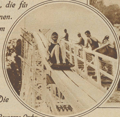
Rechts: Auf der Wasserrutschbahn in Lansanne-Ouchy

Vor einigen Jahren noch der vielbestaunte Luxus einiger fashionabler Meer- und Seekurorte, sind heute die Strandbäder beinahe eine Selbstverständlichkeit an allen jenen Plätzen geworden, die für die Anlage geeignet erscheinen. Sie sind heute ein Ort, an dem sich eine gemütliche Geselligkeit entwickelt, wo man sich an zemeinsamem Spiel ergötzt und seinen Körper der wohlthuenden Wirkung von Luft, Sonne und Wasser aussetzt. Die