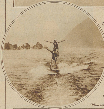
Weissenreiter bei Locarno

Fröhlichkeit ist hier so erfrischend natürlich. Man ist ja der Natur so nahe, nicht von ihr getrennt durch die dicken Soblen und die — wenigstens bei den Herren — geradezu erdrückende Umpanzerung der Kleidung. Wohl gehört auch die Mode in die Strandbäder, aber sie hat Vorliebe für Farbe und läßt die Form immer durch den Körperbestimmen.