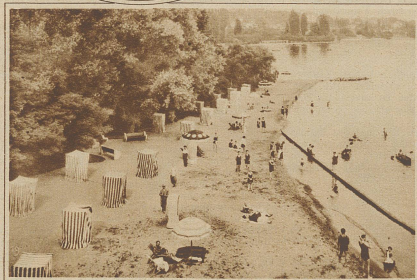
Blick auf die Plage von Lansanne-Ouchy

von der Kinderzeit zu träumen. Welche Wonne, sich im Wasser zu wiegen, ganz unspült zu werden von dem erquickenden Naß. Welche Lust, die Muskeln zu spannen und den ganzen Körper zu straffen, um schwim-