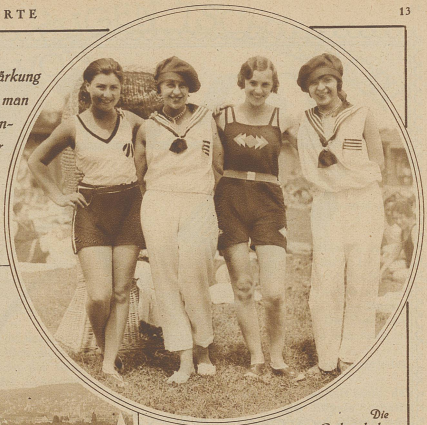
Die Bademode des Zürcher Strandbades

Sorglosigkeit, beglückt von Sonne und Wasser und erkennt plötzlich, wie wenig es eigentlich zu unserer Zufriedenheit braucht. Noch im Übermut wahrnt man hier eine erfreuliche Artigkeit und