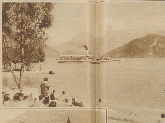
Blick vom Strandbad Weggis auf den See und die Alpen