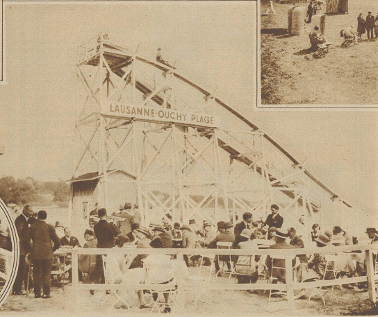
Der Teegarten von Lansanne-Ouchy-Plage