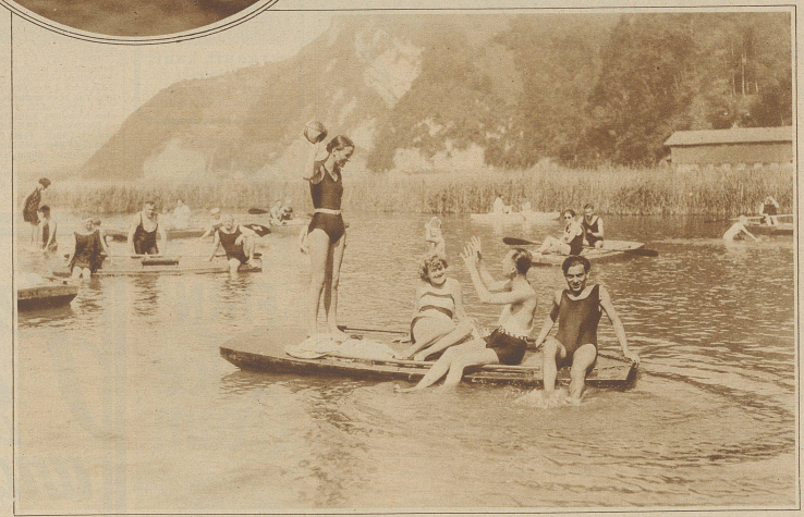
Strandbad Stansstad. Wasser und Sonne, Lust und Wonne