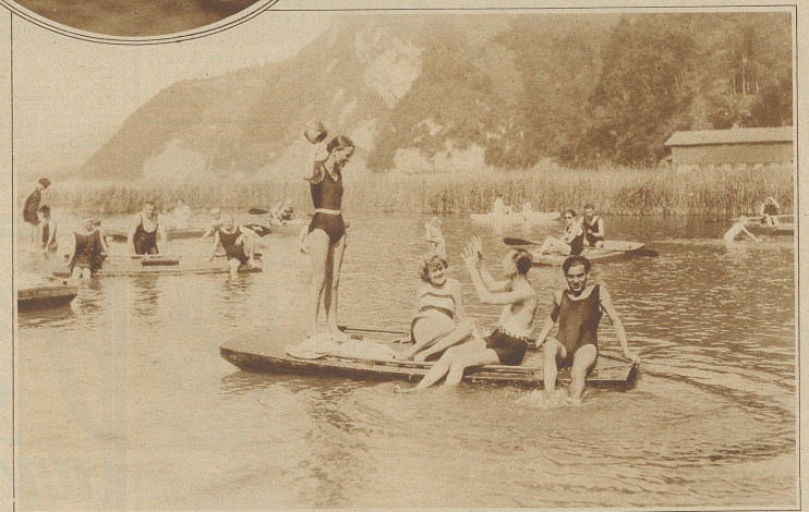
Strandbad Stansstad. Wasser und Sonne, Lust und Wonne