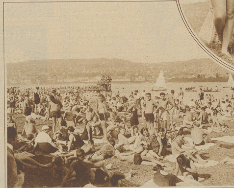
Hobbetrieb im Strandbad Zürich

mend ein lockendes Ziel zu erreichen. Und wie ergötzt vergißt man sich bei den reizenden Land- und Wasserspielen. Harmlos neckisch kommt man sich nahe und sieht in allen Menschen mitfreundende Brüder und Schwestern, lacht und scherzt mit ihnen und freut sich seiner Gesundheit, seines Lebens und seiner Kraft. Wonnigste Stunden der Erholung und