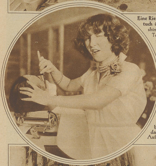
Ein New Yorker Coiffeur hat eine neue Attraktion eingeführt. Er läßt die männlichen Kunden von zarter Damenhand rasieren. Das Geschäft soll seit der Einführung dieser Neuerung, die übrigens auch in der Schweiz schon versucht wurde, - irgendwo in Baselbiet rasierte nämlich während der Grenzbesetzung eine Dame die Soldaten - einen bedeutenden Aufschwung genommen haben