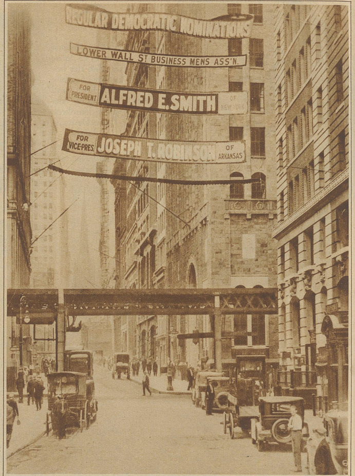
Aus dem Wahlkampf um die Präsidentenwahl in New York. Geschäftsleute der Lower Wall Street haben große Plakate über die Straße gezogen, die den Bürgern die Wahl des demokratischen Kandidaten Al Smith empfehlen