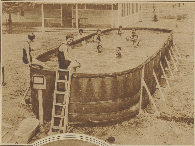
Eine Riesenbadewanne aus Segeltuch im Potomac Park in Washington. Den Besuchern dieses Touristen-Camps wird mangels eines Sees auf diese Weise Schwimmgelegenheit geboten