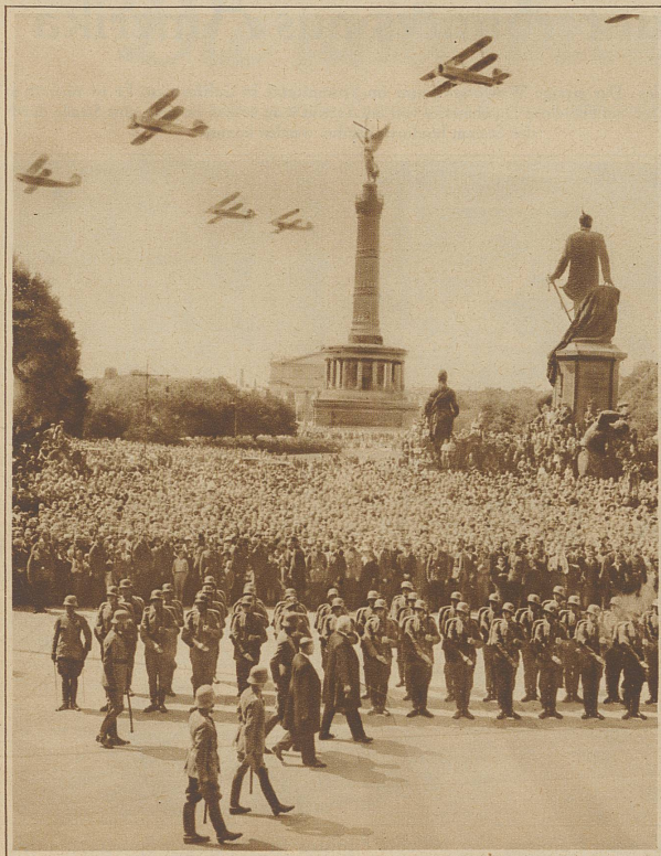
Deutsche Verfassungsfeier am 11. August in Berlin. Reichspräsident Hindenburg schreitet die Front ab