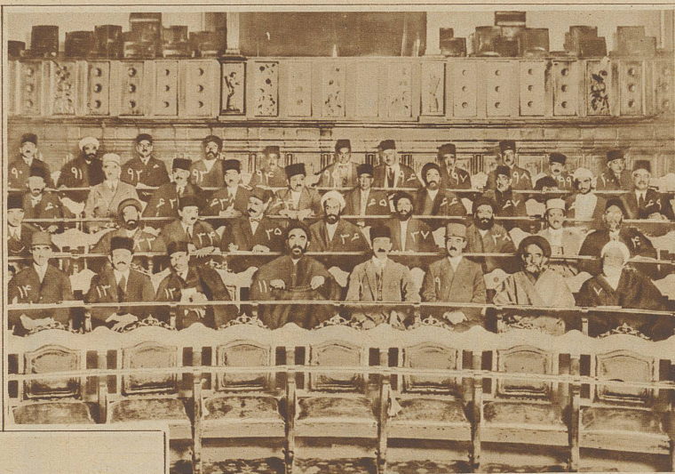
Eine interessante Aufnahme aus dem persischen Parlament während einer Sitzung

August Bebel, im bündnerisch. Bad Passugg im Alter von 73 Jahren starb