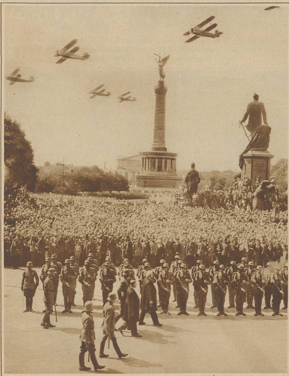
Deutsche Verfassungsfeier am 11. August in Berlin. Reichspräsident Hindenburg schreitet die Front ab