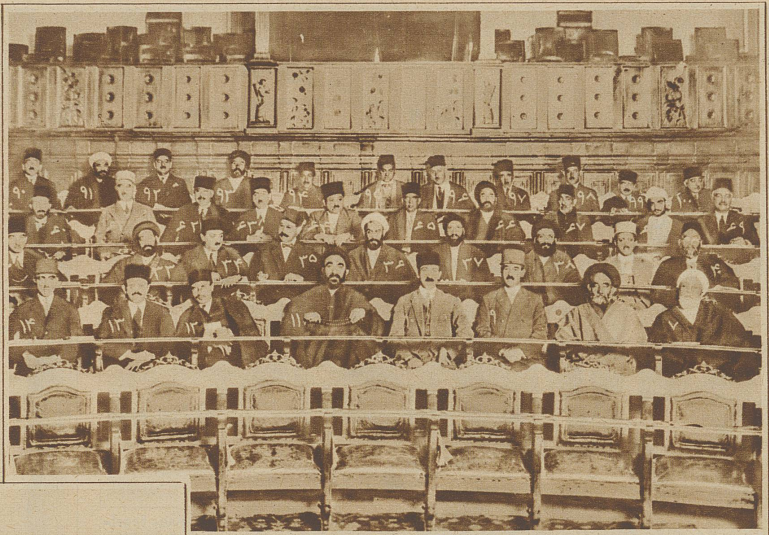
Eine interessante Aufnahme aus dem persischen Parlament während einer Sitzung