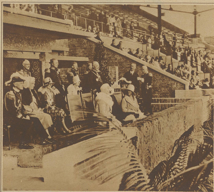
Königin Wilhelmine zu Besuch bei den Olympischen Turnwettkämpfen