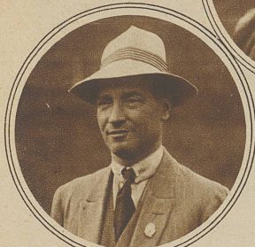
Auch Pelli scheint das holländische Klima nicht besonders zugesagt zu haben, denn auch er schloß mit 1061 Punkten 10 Punkte weniger als in Rom

Trotzdem haben wir allen Grund, uns über den schwer erkämpften Sieg zu freuen, um so mehr, als er mit einem Gesamtergebnis erfochten wurde, das 5 Punkte über dem bisherigen Weltrekordresultat vom Match in St. Gallen steht