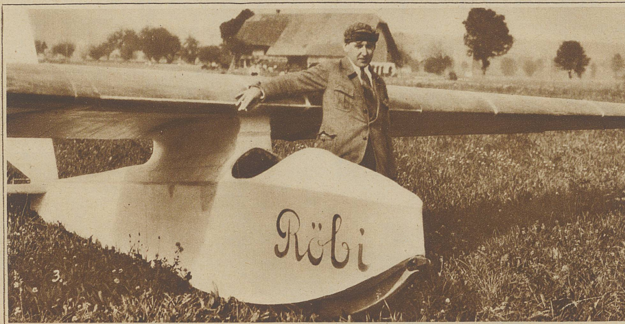
Nach dem Start auf dem Niesen = kulum Phot. Stauffiger