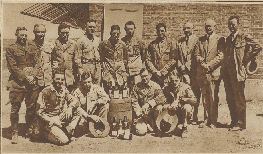
Die amerikanischen Schützen vor dem Stand in Loosduinen. Wie man sieht, benötigten sie nach getaner Arbeit die Anwesenheit in Europa, um dem Prohibitionsgesetz ein kleines Schnippchen zu schlagen