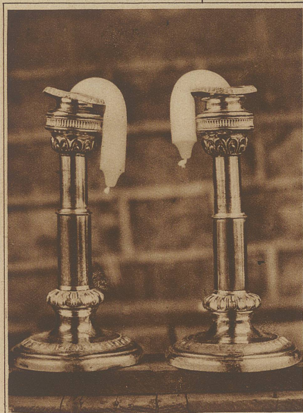
Auch eine Folge der Hitze: Weich gewordene Kerzen hängen ihre Köpfe

Amerikas Zukunfts-Architektur. Die amerikanischen Wolkenkratzer werden immer größer und höher. Der neueste, der gegenwärtig in Chicago gebaut wird, umfaßt 75 Stockwerke und wird etwa 230 Millionen Franken kosten. Das Hotel - um ein solches handelt es sich nämlich - soll ca. 1000 Zimmer und einige große Ladengeschäfte enthalten