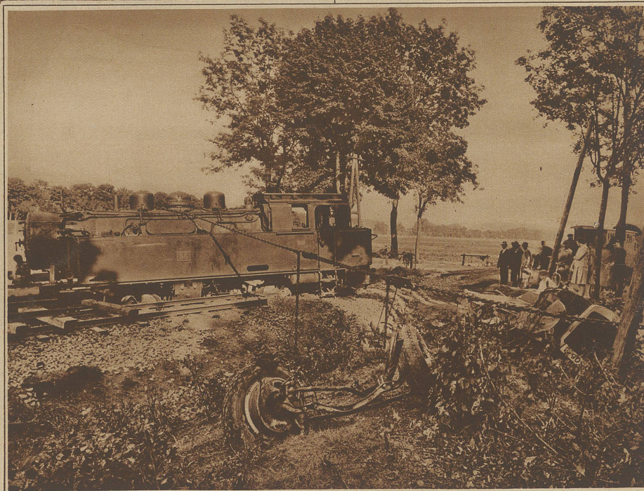
Ein furchtbares Autounglück ereignete sich bei Walkenried im Harz, wo ein Gesellschaftsauto in einen Eisenbahnzug hineinfuhr. Neun Todesopfer und viele Verletzte, meist Angehörige der in einem zweiten Auto auf einer Schulreise sich befindlichen Kinder, sind zu beklagen. Das Bild zeigt den Schauplatz der Katastrophe. Links die eben wieder aufgerichtete Lokomotive, rechts die Trümmer des Autos