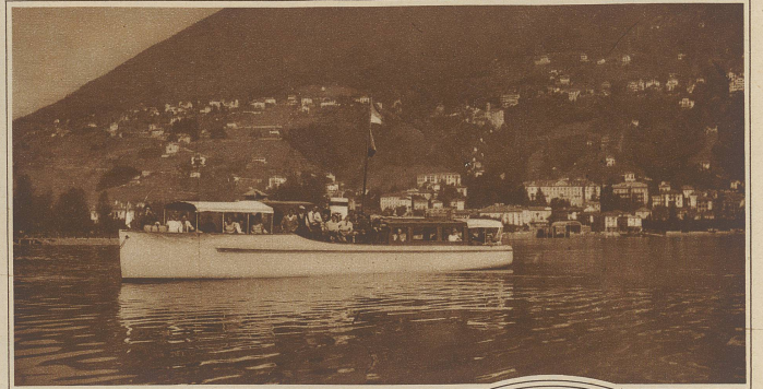
Das gesunkene Motorboot Zum Bootsunglück auf dem Lago Maggiore. Ein erst vor 2 Monaten dem Betrieb übergebenes Motorboot eines Privatunternehmens rannte bei schönstem Wetter auf der Höhe von Brissago in den ital. Kurzdampfer hinein, zerbröckelte und sank inner 3-4 Minuten. Die Passagiere konnten gerettet werden, während der Bootsführer durch das Schiff in die Tiefe gerissen wurde