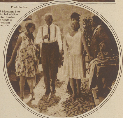
Die geretteten Passagiere, nachdem sie ihre Kleider in der nächstgelegenen Pension getrocknet hatten