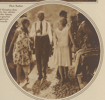
Die geretteten Passagiere, nachdem sie ihre Kleider in der nächstgelegenen Pension getrocknet hatten

Zum Bootunglück auf dem Lago Maggiore. Ein erst vor 2 Monaten dem Betrieb übergebenes Motorboot eines Privatunternehmens rannte bei schönstem Wetter auf der Höhe von Brissago in den ital. Kurdampfer hinein, zerschellte und sank inner 3-4 Minuten. Die Passagiere konnten gerettet werden, während der Bootsführer durch das Schiff in die Tiefe gerissen wurde.