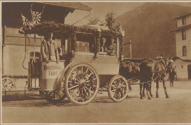
Das letzte Pferdetrain in Davos