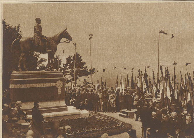
In Cassel (Nordfrankreich) wurde am Sonntag das Denkmal für Marshall Foch eingeweiht. Foch wohnte der Feier persönlich bei. Im Bilde verliert Ministerpräsident Poincaré seine Enthüllungsansprache