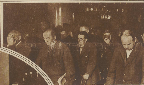
Die Angeklagten bei der Verlesung ihrer Todesurteile. An 5 Angeklagten ist das Urteil inzwischen vollstreckt worden