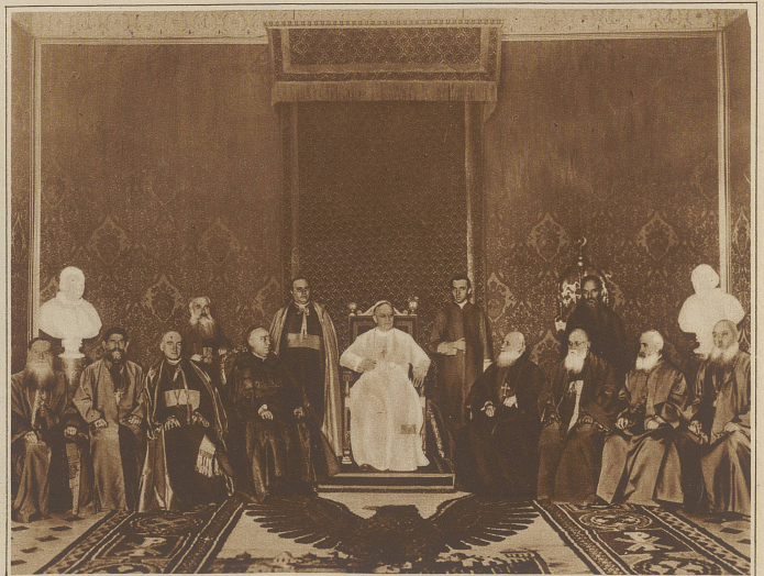
Eine seltene Aufnahme von Papst Pius XI. Das Bild wurde anlässlich des Empfanges der armenischen Kirchensynode im Vatikan aufgenommen