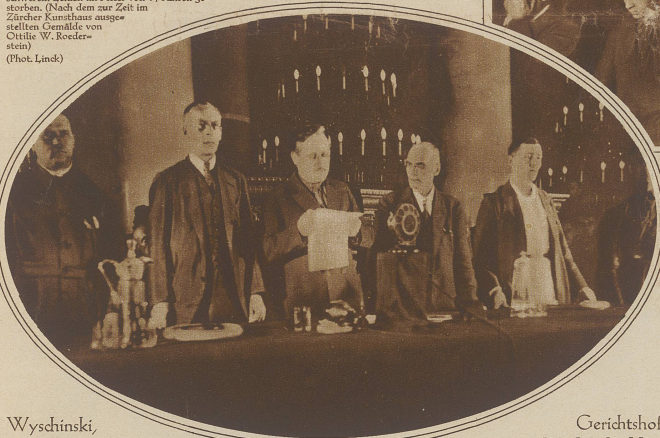
Wyshinski, der Vorsitzende des