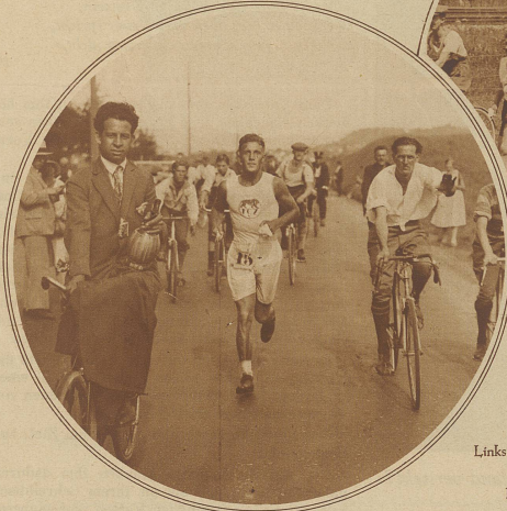
Momentbild aus dem Lauf vor Horgen