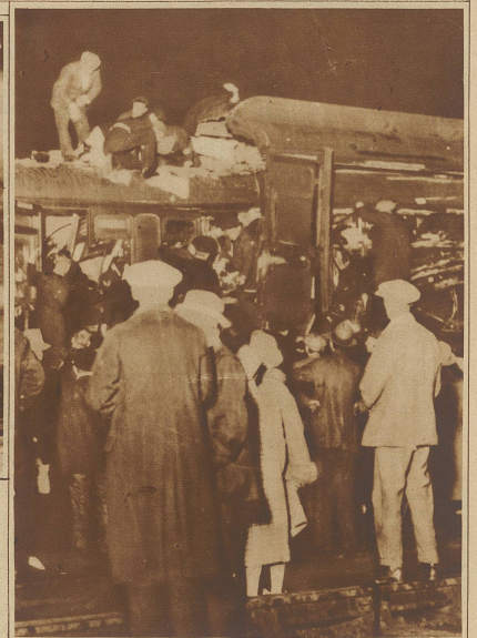
Bild rechts: Ärzte machen den in den Trümmern eingeklemmten Reisenden Morphium-Einspritzungen, um ihnen die Schmerzen zu lindern, bis sie aus der schrecklichen Lage befreit werden können

In der Nacht auf Donnerstag ereignete sich in der Nähe der Station Darlington die furchtbarste Eisenbahnkatastrophe, die England in den letzten 20 Jahren heimgesucht hat. Ein Vergnügungszug fuhr mit voller Wucht in einen Güterzug hinein, wodurch die vordersten Wagen buchstäblich ineinandergeschachtelt wurden. Die Zahl der Toten beträgt 25, die der Verletzten über 50.