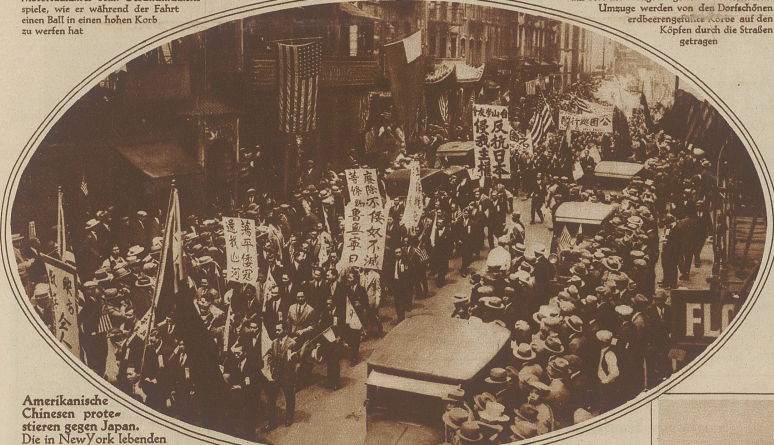
Amerikanische Chinesen protestieren gegen Japan. Die in New York lebenden Chinesen veranstalteten einen großen Demonstrationstanz gegen die japanische Invasion in China. Unser Bild zeigt den Zug auf dem Marsch durch den chinesischen Stadtteil von New York