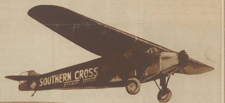
Im Fluge über die Meere. Der amerikanische Flieger Kingsford Smith hat mit seinem Flugzeug «Southern Cross» als Erster den Pazifischen Ozean von Kalifornien nach Australien überflogen. Er ist mit seinem Flugzeug «Kreuz des Südens» glücklich in Sidney gelandet und von 200000 Menschen mit höchster Begeisterung empfangen worden