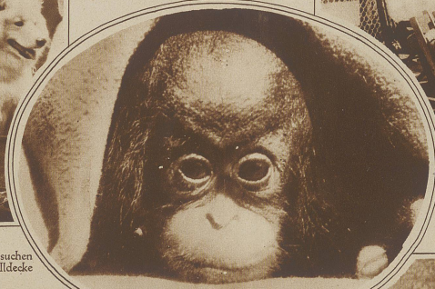
Bild rechts: Wie gefällt Ihnen dieses Schoßkind? Erst nach zahllosen Versuchen gelang es, den jungen Schimpansen, der immer nur vorsichtig unter seiner Wolldecke hervorsah, wenn er den Photoapparat erblickte, im Bilde festzuhalten