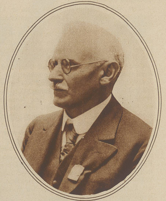
Der berühmte arktische Forschungsreisende, Prof. Otto Nordenskiöld, der eine Reihe wissenschaftlicher Expeditionen in das nördliche Polargebiet führte, ist in Örebro an den Folgen einer Verletzung, die er sich bei einem Autounfall zugezogen hat, gestorben.