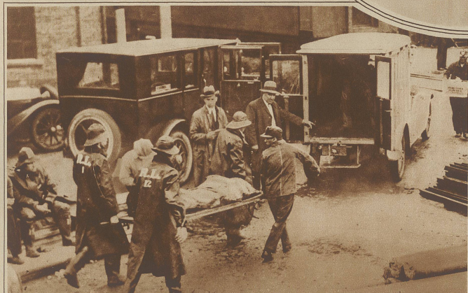
Eine schwere Explosionskatastrophe hat sich in der amerikanischen Kohlengrube Mather, Pa. ereignet, wo durch ein schlagendes Wetter 160 Mann eingeschlossen wurden. Die Rettungsarbeiten gestalteten sich infolge des entstandenen Grubenbrandes äußerst schwierig. Die Zahl der Toten wird auf 64 angegeben