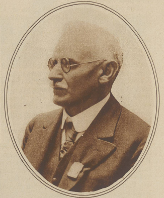
Der berühmte arktische Forschungsreisende, Prof. Otto Norden-skjöld, der eine Reihe wissenschaftlicher Expeditionen in das nördliche Polargebiet führte, ist in Göteborg an den Folgen einer Verletzung, die er sich bei einem Autounfall zugezogen hat, gestorben