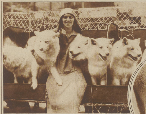
Eine Familie prächtiger Samojedenhunde

Bild rechts: Wie gefällt Ihnen dieses Schoßkind? Erst nach zahllosen Versuchen gelang es, den jungen Schimpansen, der immer nur vorsichtig unter seiner Wolldecke hervorsah, wenn er den Photoapparat erblickte, im Bilde festzuhalten