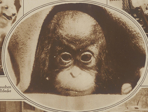
Bild rechts: Wie gefällt Ihnen dieses Schoßkind? Erst nach zahllosen Versuchen gelang es, den jungen Schimpansen, der immer nur vorsichtig unter seiner Wolldecke hervorsah, wenn er den Photoapparat erblickte, im Bilde festzuhalten.