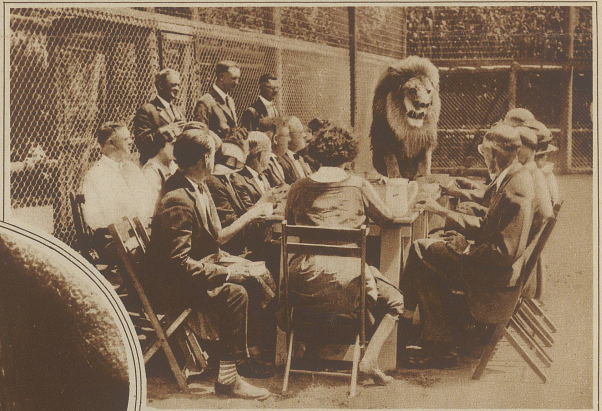
Ein ungebetener Gast. Auf einer kalifornischen Löwenfarm lud der Besitzer eine größere Gesellschaft zu Tische. Das Essen wurde im leeren Löwenkäfig serviert und man saß gemütlich beim Kaffee, als plötzlich ein prächtiger Löwe erschien und sich oben an den Tisch zu der nicht wenig überraschten Gesellschaft setzte.