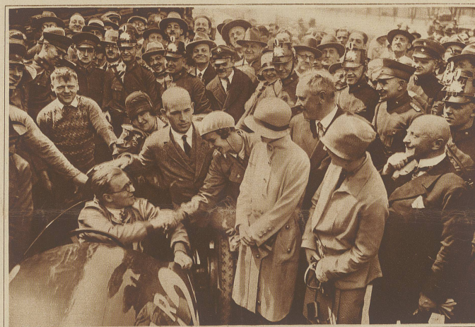
Fritz von Opel, der Führer des Wagens; hinter ihm, auf dem Rad sitzend, der Erfinder Valier

Einen ganz andern Weg als Goddard, Oberth und Hoefft will der aus Südtirol stammende Münchner Flieger und Astronom Max Valier