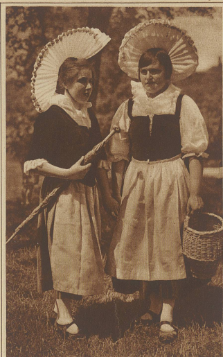
Die beiden neuen Trachten von Schwyz (links) und der March (rechts)