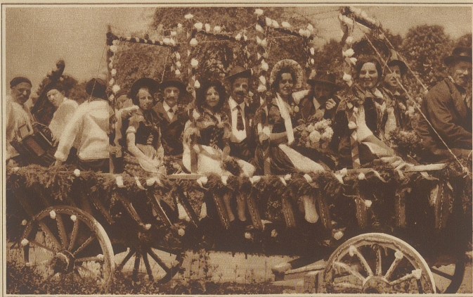
Bauernhochzeit zu Großvaters Zeiten. Aus dem Festzug anlässlich des Schwyzer kantonalen Schwyz- und Aepferfestes in Stöben