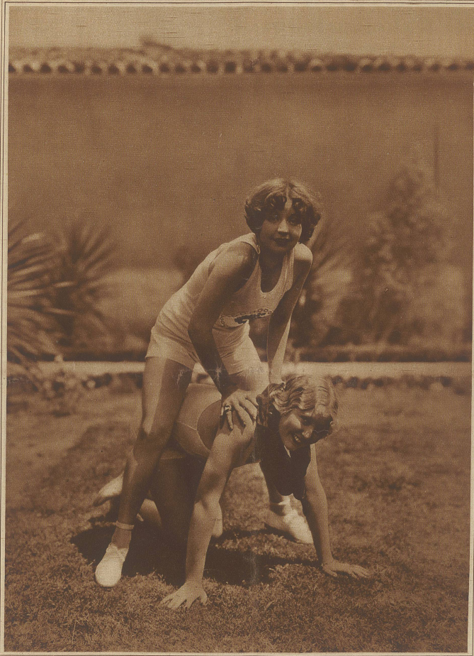
Wie bleibe ich jung und schön.

«Ziehen wir weit fort, Yat-Yat? Werde ich