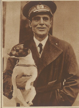
General Nobile mit seinem kleinen Foxterrier, der ihn als Mascotte auf den Polflug begleitete