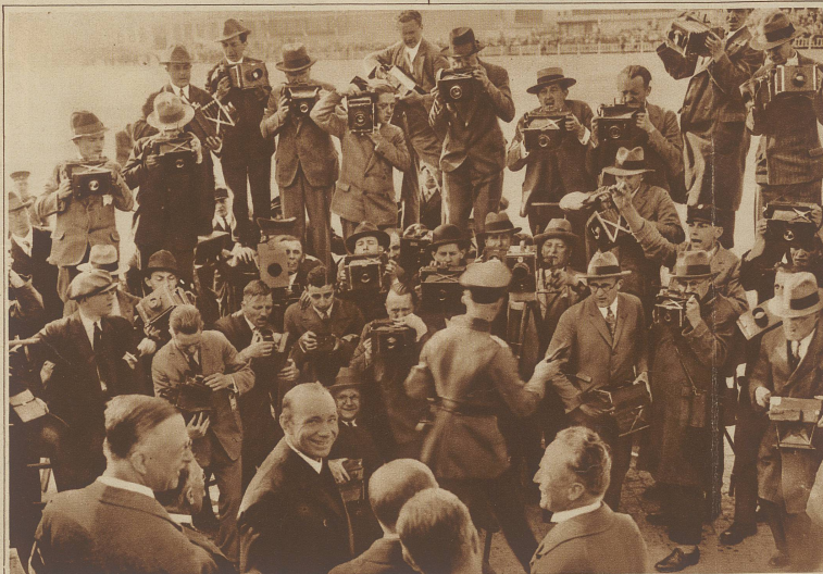
Der Polflieger Capt. Wilkins (lachend gegen den Apparat gekehrt) im Kreuzfeuer der Berliner Presse-Photographen