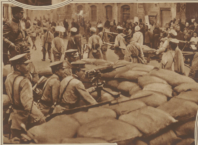
Rückzug geschlagener Truppen der chinesischen Nordarmee durch eine Straße von Tsinan. Im Vordergrund ein japanisches Maschinengewehr in Stellung