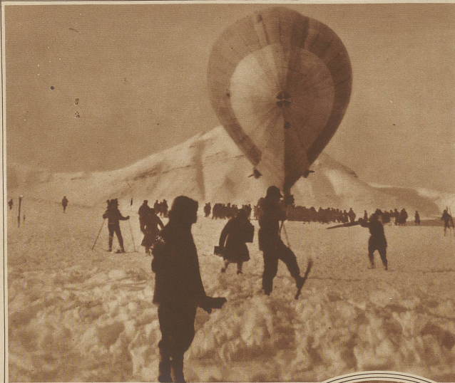
Die letzte Aufnahme der «Italia» beim Start zum Polflug