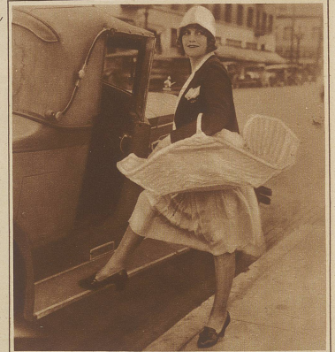
Bild rechts: Das Baby im Gemüsekorb. Wenn die Damen New Yorks Einkäufe besorgen

wollen, so können sie jetzt unauffällig ihr Baby mitnehmen. Es ruht friedlich in einem besonders dafür gebauten Korb, neben Obst, Gemüse etc.