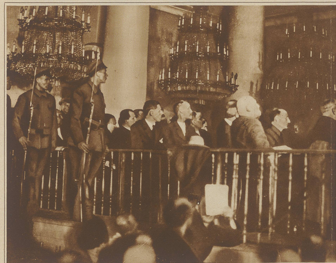
Der Prozeß gegen die Verschwörer des Dones-Bekens, 50 Russen und drei deutsche Ingenieure sind der «Organisation und Förderung einer wirtschaftlichen gegenrevolutionären Verschwörung» angeklagt. Es ist damit zu rechnen, daß etwa 50 der angeklagten Russen zum Tode verurteilt werden, während die drei Deutschen aus außenpolitischen Gründen wohl nur mit Freiheitsstrafen davonkommen werden. Das Bild zeigt einen Blick auf die Anklagebank, die von Rotgardisten mit aufgefingtem Bajonett bewacht wird.