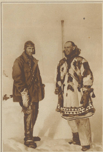
Captain Wilkins und Lt. Eielson bei ihrer Ankunft in Spitzbergen nach der Ueberfliegung des Nordpols.