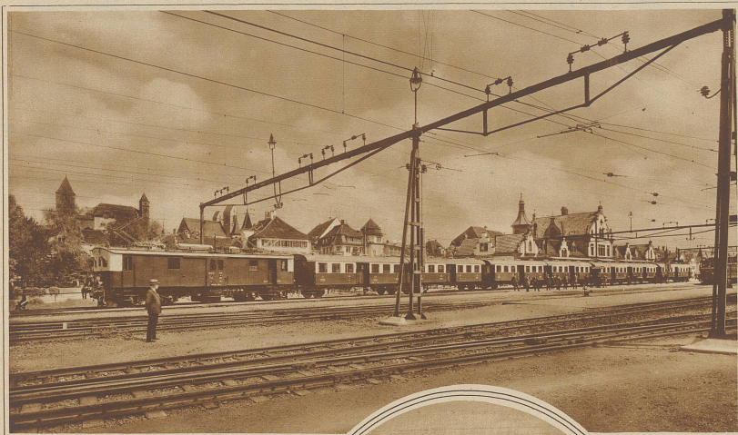
Die neuen Vorortzüge der Schweiz Bundesbahnen, die versuchsweise vorerst auf den Strecken Basel-Olten und Zürich-Rapperswil verkehren werden. Der Zug besteht aus je einem Motorwagen und einem Zugführungswagen, sowie aus drei Doppelwagen, die kurz gekuppelt und durch Faltenballe und bequemem Übergang verbunden sind. Jedes Rangieren des Motorwagens fällt weg, da der Motorwagen auch von dem am anderen Ende sich befindenden Führerwagen aus gesteuert werden kann, so daß also nur der Führer die Kabine zu wechseln hat. Alle Türen werden vom Führerstand aus automatisch auf einen Schlag geschlossen, sobald sich der Zug in Bewegung gesetzt hat. — Das Rollmaterial des ganzen Zuges wurde von der Schweiz Waggonfabrik Schlieren, die elekt. Ausrüstung von Schemm in Gené geliefert.