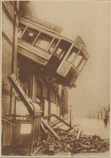
Ein eigenartiges Straßenbahnunglück ereignete sich in einem Vorort von Brüssel, wo ein Straßenbahnwagen durch ein Haus fuhr und auf der andern Seite über eine Straße hingab. Verletzt wurde niemand, aber ungenützlich muß die Situation doch gewesen sein.