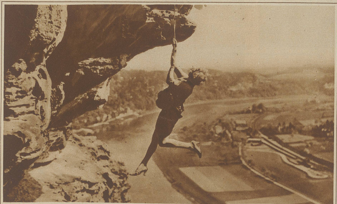
Ein weiblicher Albertini ist dem Film durch den jungen deutschen Star Hilda Rosch entstanden. Wie unser Bild zeigt, vollführt die Dame die tollkühnsten Kletterkunststücke, und das alles nur, um in einem neuen Film der Sensationslust des Publikums zu genügen.