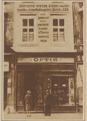
Ein Wiener Hausbesitzer hat zum Protest gegen die drückenden Bestimmungen des Mieterschutzes an der Fassade seines Hauses eine Inschrift anbringen lassen, worin er darauf hinweist, daß sämtliche Mieter seines Hauses zusammen jährlich nur so viel Zins bezahlen, wie ein armer Arbeiter für sein Bett im Männerheim bezahlen müsse.