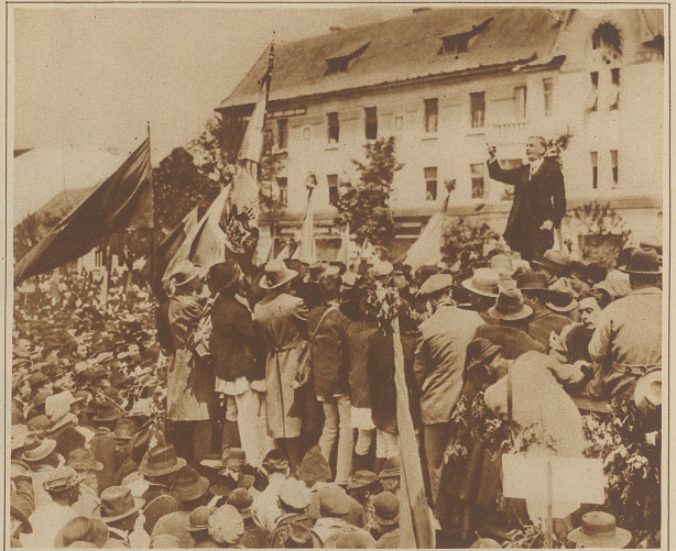
Vom Bauernaufstand in Rumänien. Die gewaltige Künigsburg von Alota Jufia während der Ansprache des Bauernführers Maniu. Die Zahl der Demonstranten wird auf 50 000 angegeben.