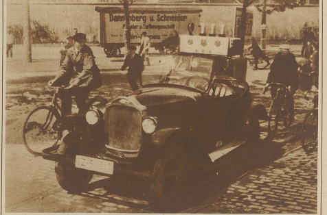
In den Straßen Kölns erregte dieser Tage ein führerloses Auto großes Aufsehen. Durch elektrische Fernsteuerung gelang es, den Wagen in verschiedenen Fahrgeschwindigkeiten gefahrlos durch den Straßenverkehr zu steuern.