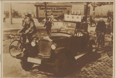
In den Straßen Kölns erregte dieser Tage ein führerloses Auto großes Aufsehen. Durch elektrische Fernsteuerung gelang es, den Wagen in verschiedenen Fahrgeschwindigkeiten gefahrlos durch den Straßenverkehr zu steuern.