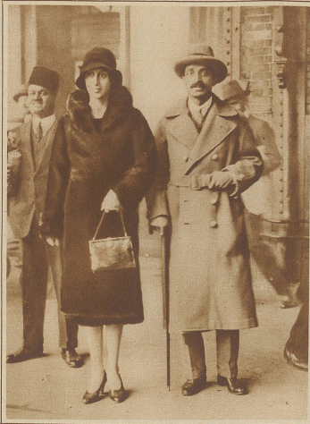
Der Maharadscha von Indore, der vor wenigen Wochen die junge Amerikanerin Nancy Millar heiratete, ist nach Paris zurückgekehrt. Die junge Dame, die zum Brahminismus übertrat, war in Indien Gegenstand pompöser Festlichkeiten.