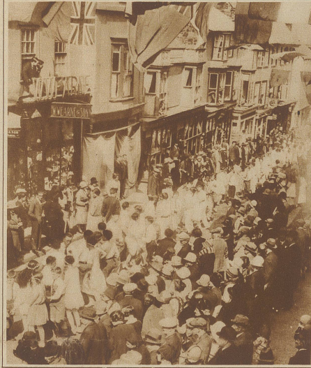
Alljährlich findet in Helston, einer kleinen englischen Stadt, ein Tanztag statt. Ganze Prozessionen von alt und jung durchtanzten unermüdlich die reichbelagerten Straßen bis in die späte Nacht hinein.