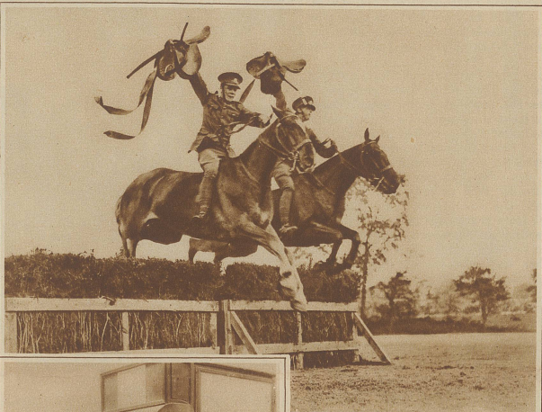
Reiterkunststücke englischer Soldaten, die während des Rennens den Sattel losgeritten und auf dem bloßen Pferderücken über die Hindernisse sprangen.