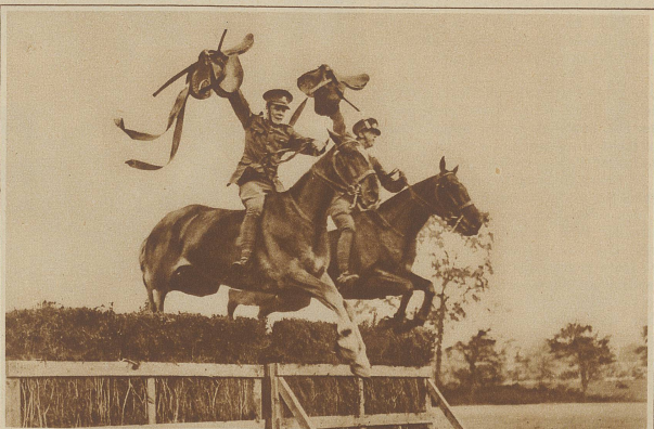
Reiterkunststücke englischer Soldaten, die während des Rennens den Sattel losgurten und auf dem bloßen Pferderücken über die Hindernisse springen.