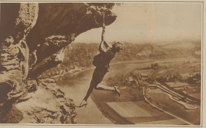
Ein weiblicher Albertini ist dem Film durch den jungen deutschen Star Hilda Rosch entstanden. Wie unser Bild zeigt, vollführt die Dame die tollkühnsten Kletterkunststücke, und das alles nur, um in einem neuen Film der Sensationslust des Publikums zu genügen.