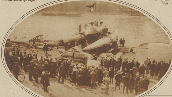
Der Ozeano-Glasseur ist das neueste Vehikel, mit welchem die Überquerung des Ozeans im nächsten Monat versucht werden soll. Wie das Bild zeigt, handelt es sich um ein Climbee, das außer mit Schrauben auch mit Luftpropellern angetrieben wird. Man rechnet mit einer durchschnittlichen Geschwindigkeit von gegen 100 km