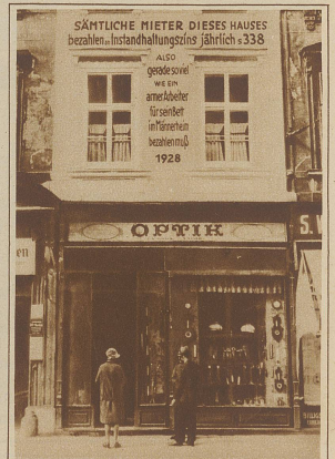
Ein Wiener Hausbesitzer hat zum Protest gegen die drückenden Bestimmungen des Mieterschutzes an der Fassade seines Hauses eine Inschrift anbringen lassen, worin er darauf hinweist, daß sämtliche Mieter seines Hauses zusammen jährlich nur so viel Zins bezahlen, wie ein armer Arbeiter für sein Bett im Männerheim bezahlen müsse.