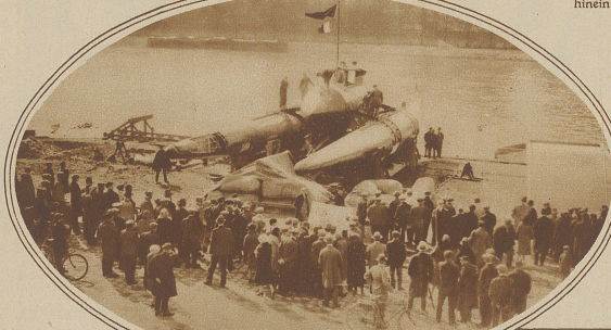
Der Ozeano-Glasseur ist das neueste Vehikel, mit welchem die Überquerung des Ozeans im nächsten Monat versucht werden soll. Wie das Bild zeigt, handelt es sich um ein Cribboot, das außer mit Schrauben auch mit Luftpropellern angetrieben wird. Man rechnet mit einer durchschnittlichen Geschwindigkeit von gegen 100 km.