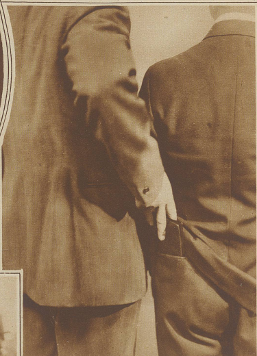
Wie's gemacht wird. Ein Taschendieb an der Arbeit