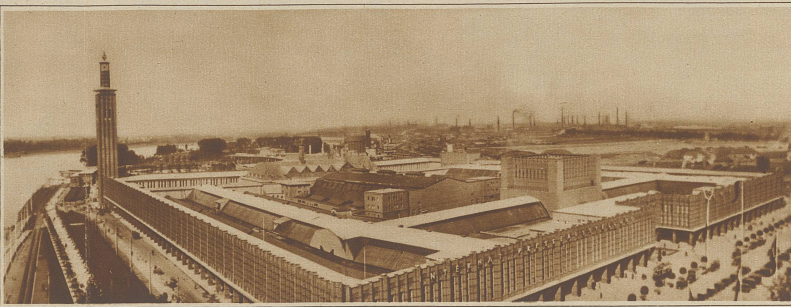
Gesamtansicht der großen Internationalen Presseausstellung in Köln, die am 10. Mai eröffnet wurde