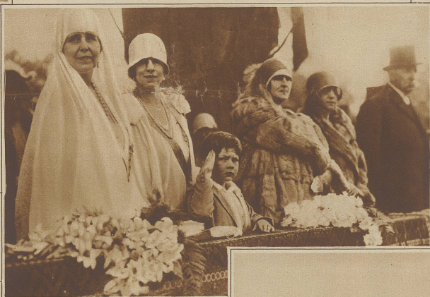
Aus Anlaß der rumänischen Unabhängigkeitsfeier fand in Bukarest erstmals eine große Truppenparade vor dem jungen König Michael statt. Das Bild zeigt ihn grüßend in Begleitung seiner Mutter, seiner Großmutter und der Erzherzogin Elisabeth von Griechenland. Uns scheint allerdings, der Knabe zeige größeres Interesse für den Photographen als für die Soldaten