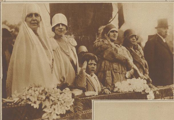
Aus Anlaß der rumänischen Unabhängigkeitsfeier fand in Bukarest erstmals eine große Truppenparade vor dem jungen König Michael statt. Das Bild zeigt ihn grüßend in Begleitung seiner Mutter, seiner Großmutter und der Ekönigin Elisabeth von Griechenland. Uns scheint allerdings, der Knabe zeige größeres Interesse für den Photographen als für die Soldaten