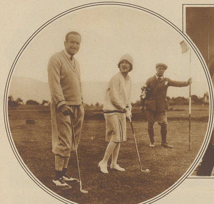
Douglas Fairbanks ist mit seiner Gemahlin Mary Pickford zum Kuraufenthalt in Genf eingetroffen. Das Bild zeigt die beiden beim Golfspiel