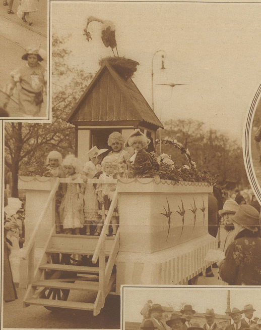
Wie der Storch die Kinder bringt