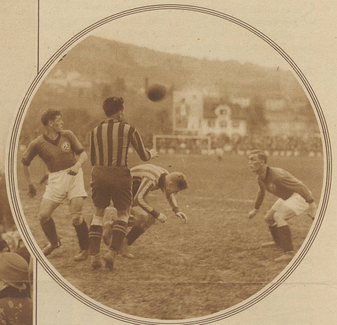
Kampfbild aus dem Spiel Young Fellows-Young Boys