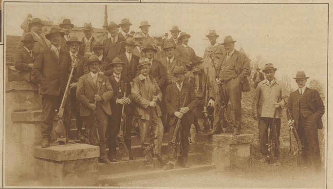
Die Schweizer Matchschützen anlässlich des Trainingschießens im Albisgütli Phot. Schmid