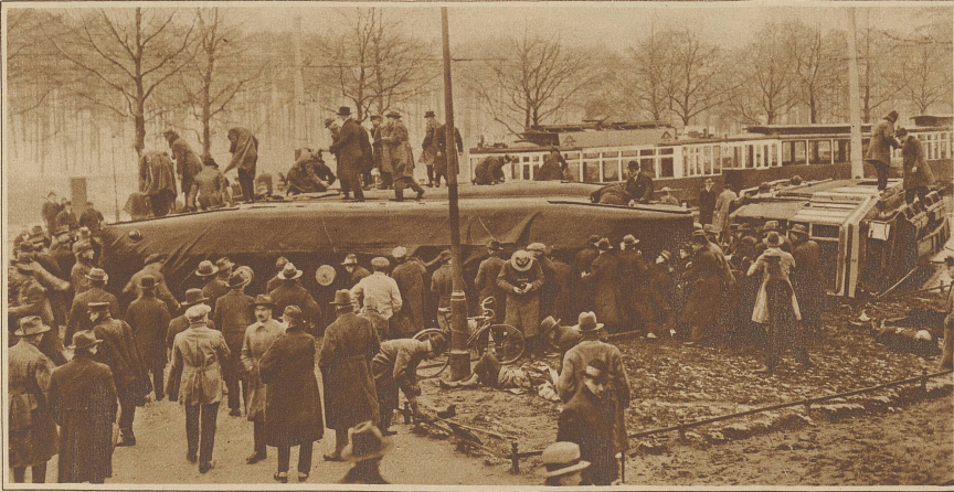
Straßenbahnunglück in Berlin. Am Sonntagnachmittag entgleiste in einer Kurve ein vom Stadion herkommender Straßenbahnzug. Alle drei Wagen stürzten um. Die Zahl der Verunglückten beträgt 96. Davon wurden 5 getötet, 31 mehr oder weniger schwer verletzt und 60 leicht verwundet. Einer unserer Mitarbeiter befand sich im Unglückszug und konnte dieses gräßliche Bild unmittelbar nach dem Unglück aufnehmen