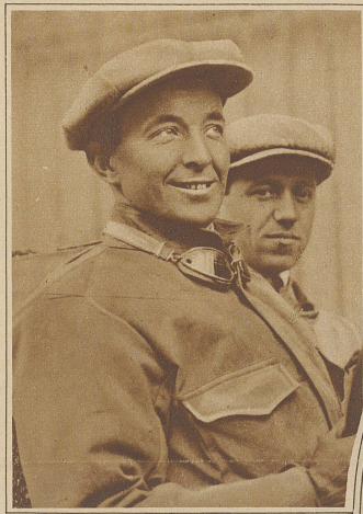
Der bekannte Autorennfahrer Bordini ist auf einer Versuchsfahrt in Turin zu Tode gestürzt. Ein in die Rennbahn gesprungener Hund brachte das Auto zum Stürzen