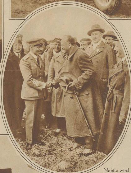
Nobile wird nach der Landung von einem Vertreter der deutschen Regierung begrüßt