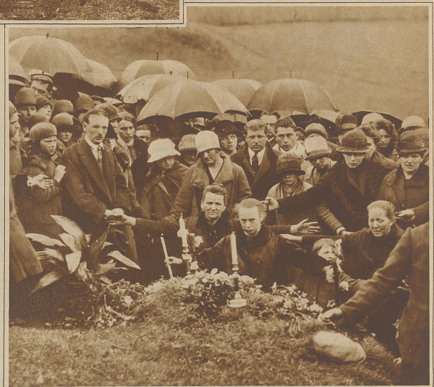
Von einem seltsamen Wunder wird aus den Vogesen berichtet, wo ein 13-jähriges Mädchen behauptet, daß ihm jeden Nachmittag um 4 Uhr an einem bestimmten Platz die Mutter Gottes erscheine. Die Nachricht fand natürlich rasche Verbreitungen und nun pilgern jeden Tag Hunderte von Gläubigen zu dem Flecken hin, wo das Kind seine Gebete verrichtet