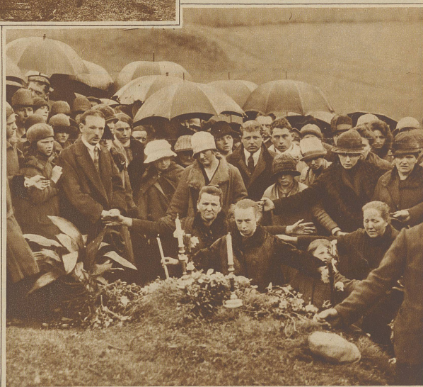
Von einem seltsamen Wunder wird aus den Vogesen berichtet, wo ein 13-jähriges Mädchen behauptet, daß ihm jeden Nachmittag um 4 Uhr an einem bestimmten Platz die Mutter Gottes erscheine. Die Nachricht fand natürlich rasche Verbreitungen und nun pilgern jeden Tag Hunderte von Gläubigen zu dem Flecken hin, wo das Kind seine Gebete verrichtet

Bild 11 n.k.s. Dem Flug ins Weltall entgegen. Der erste praktische Schritt zum Flug ins Weltall ist letzte Woche in München getan worden, wo ein von zwei Ingenieuren konstruiertes Raketenauto die ersten Versuchsfahrten machte und schon nach 8 Sekunden eine Geschwindigkeit von 500 km erreichte. Man sieht hinten die 12 Auspuffrohre, denen während des Betriebes die fauchenden Feuerstrahlen entströmen