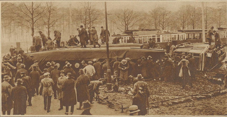
Straßenbahnunglück in Berlin. Am Sonntagnachmittag entgleiste in einer Kurve ein vom Stadion herkommender Straßenbahnzug. Alle drei Wagen stürzten um. Die Zahl der Verunglückten beträgt 96. Davon wurden 5 getötet, 31 mehr oder weniger schwer verletzt und 60 leicht verwundet. Einer unserer Mitarbeiter befand sich im Unglückszug und konnte dieses gräßliche Bild unmittelbar nach dem Unglück aufnehmen