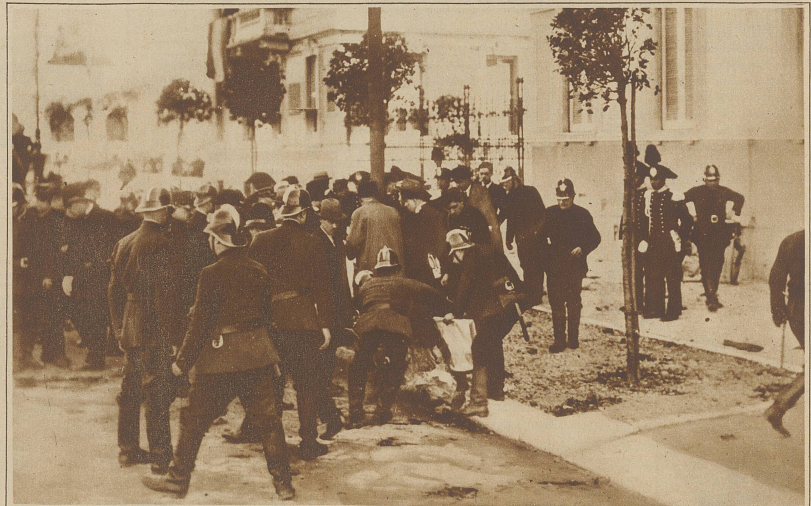
Zum Attentat auf den König von Italien. Aufräumungs- und Bergungsarbeiten nach dem Attentat