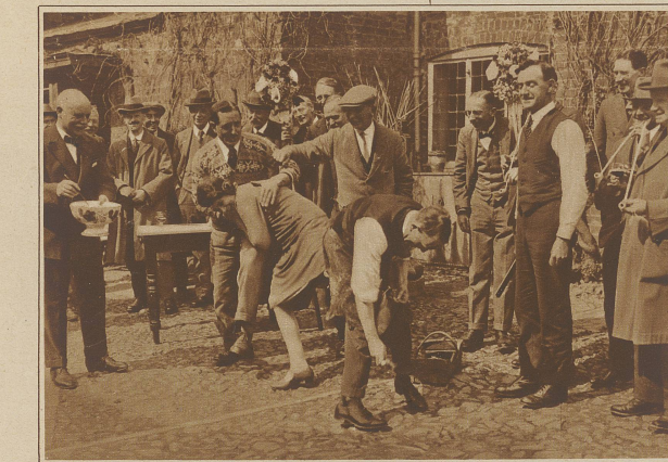
Ein anderer, nicht minder amüsanter Brauch besteht darin, daß die jungen Damen "beschlagen" werden. "Das Beschlagen der Füllen" nennt der Engländer diesen Brauch und will damit sagen, daß die betreffenden Damen die Backfischjahre vollendet haben und mannbar geworden sind