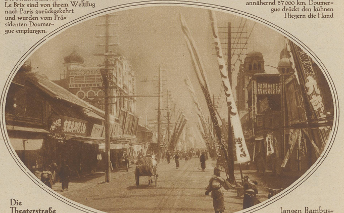
Die Theaterstraße in Yokohama, Japan. Ueber der Straße flattern an