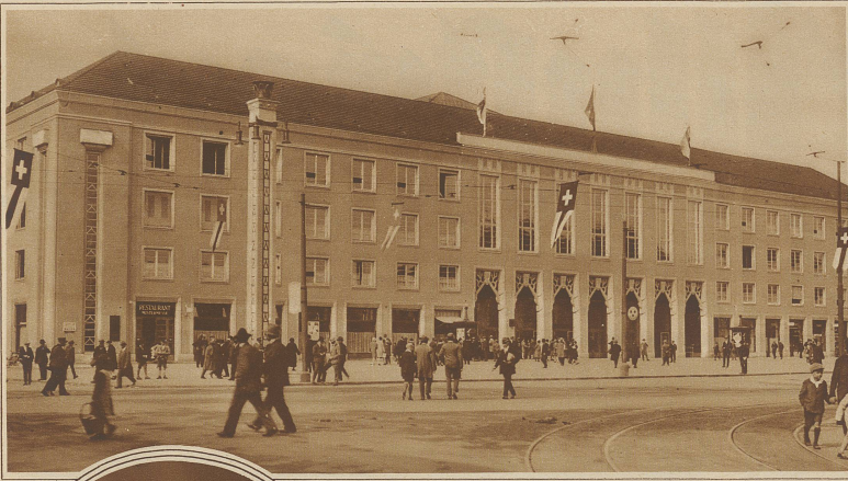
Die Hauptfront des Messegebäudes