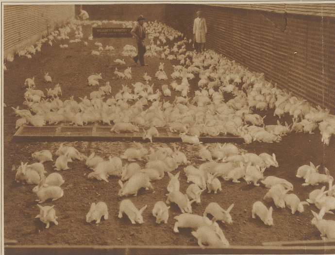
Wo die Kaninchenpelze herkommen. Eine Kaninchenfarm in Los Angeles, die nur weiße Kaninchen züchtet und jede Woche Tausende von Fellen auf den Markt bringt