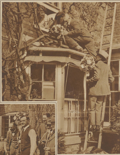
Eigenartige Volksbräuche haben sich in großer Zahl in England bis auf den heutigen Tag erhalten. So werden beispielsweise in Hungerford alljährlich zwei sog. Tuttimen gewählt, die am zweiten Dienstag nach Ostern das Recht haben, alle Dorfschönen zu küssen. Jeden Kuß belohnen sie mit Blumen; im Falle der Verweigerung wird eine Geldbuße einbezogen, die einer wohlthätigen Institution zugute kommt. Unser Bild zeigt, daß die Tuttimen nicht nur nach Ueberwindung von allerlei Hindernissen zu ihrem Rechte kommen