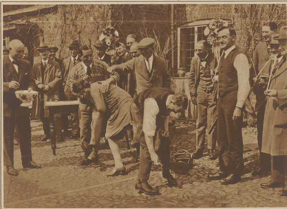
Ein anderer, nicht minder amüsanter Brauch besteht darin, daß die jungen Damen "beschlagen" werden. "Das Beschlagen der Füllern" nennt der Engländer diesen Brauch und will damit sagen, daß die betreffenden Damen die Backfischjahre vollendet haben und mannbar geworden sind