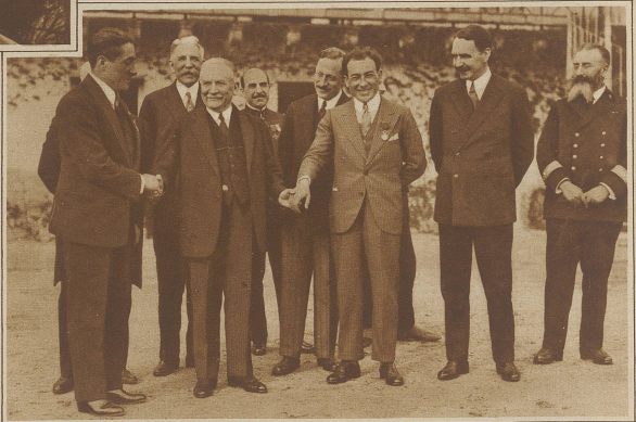
Die beiden französischen Fieger Costes und Le Brix sind von ihrem Weltflug nach Paris zurückgekehrt und wurden vom Präsidenten Doumergue empfangen.