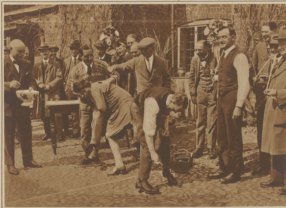
Ein anderer, nicht minder amüsanter Brauch besteht darin, daß die jungen Damen „beschlagen“ werden. „Das Beschlagen der Füllen“ nennt der Engländer diesen Brauch und will damit sagen, daß die betreffenden Damen die Backfischjahre vollendet haben und mannbar geworden sind

Eigenartige Volksbräuche haben sich in großer Zahl in England bis auf den heutigen Tag erhalten. So werden beispielsweise in Flungerford alljährlich zwei sog. Tuttimen gewählt, die am zweiten Dienstag nach Ostern das Recht haben, alle Dorfschönen zu küssen. Jeden Kuß belohnen sie mit Blumen; im Falle der Verweigerung wird eine Geldbuße eingezogen, die einer wohlthätigen Institution zugute kommt. Unser Bild zeigt, daß die Tuttimen oft nur nach Ueberwindung von allerlei Hindernissen zu ihrem Rechte kommen