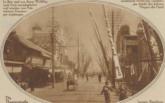
Die Theaterstraße in Yokohama, Japan. Ueber der Straße flattern an