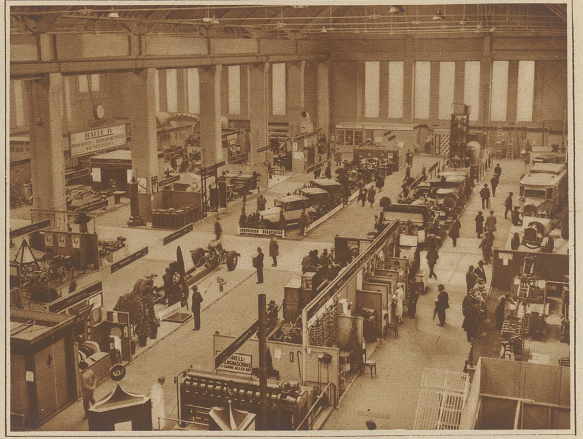
Blick in die Maschinenhalle