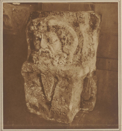
Neue Römerfunde in Genf. Die im Laufe der letzten Jahre in Genf gemachten Funde aus der Römerzeit haben in diesen Tagen eine interessante Bereicherung erfahren. In einem Keller der Altstadt, der offenbar an die einstige römische Verteidigungsmauer anstößt, sind Bruchstücke antiker Bauwerke entdeckt worden, d. h. Fragmente von Säulen, eines Architraves und eines Frieses. Der letztere trägt neben Resten einer Inschrift die Skulptur eines bärtigen Männerkopfes, der nach Ansicht der Sachverständigen als ein Bild des Jupiter Ammon darstellt. Unsere Abbildung zeigt dieses schönste Stück der neuen Funde