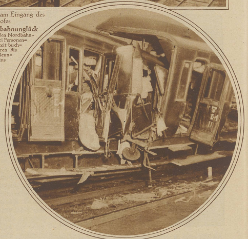
Zwei vollständig ineinandergeschachtelte Wagen. Die Coupés des vordersten Zweitklasswagens sind rasiert, alle darin sitzenden Passagiere wurden getötet