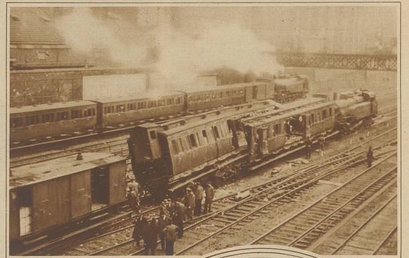
Auf der Unglücksstelle am Eingang des Nordbahnhotels

Ein schreckliches Eisenbahnunglück hat sich vor der Einfahrt in den Nordbahnhof von Paris ereignet, wo zwei Personenzüge mit voller Geschwindigkeit buchstäblich ineinander hineinfuhren. Bis jetzt sind 16 Tote zu beklagen. Neunzehn Schwerverletzte wurden ins Spital transportiert.