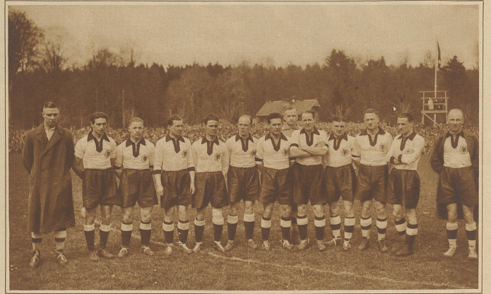
Die Mannschaft Deutschlands