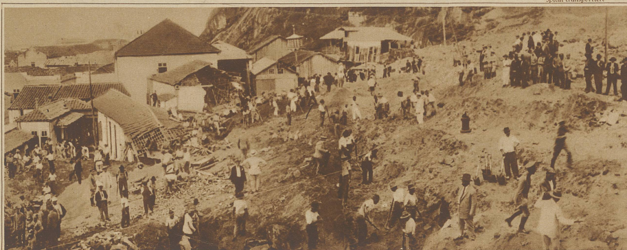
Zur Bergsturz-katastrophe in Santos (Brasilien). Rettungsmannschaften suchen nach den über 100 Verschütteten

Ein schreckliches Eisenbahnunglück hat sich vor der Einfahrt in den Nordbahnhof von Paris ereignet, wo zwei Personenzüge mit voller Geschwindigkeit buchstäblich ineinander hineinfuhren. Bis jetzt sind 16 Tote zu beklagen. Neunzehn Schwerverletzte wurden ins Spital transportiert.