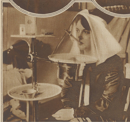
Das Dampfbad als Schönheitsmittel. Ein amerikanischer Erfinder hat einen Apparat konstruiert, der zur Erhaltung eines frischen und reinen Teints dienen soll. Es handelt sich um ein Dampfbad, bei dem das Gesicht vollständig abgeschlossen ist; die Luft wird durch ein schmales Rohr durch den Mund zugeführt.