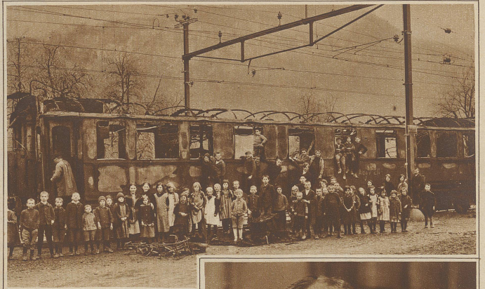
Vorige Woche geriet bei der Durchfahrt auf der Station Flums ein österreichischer Wagen I. und II. Klasse des Schnellzuges Paris-Wien in Brand. Die Fahrgäste konnten sich rechtzeitig in Sicherheit bringen, dagegen blieb der größte Teil des Handgepäckes in den Flammen.