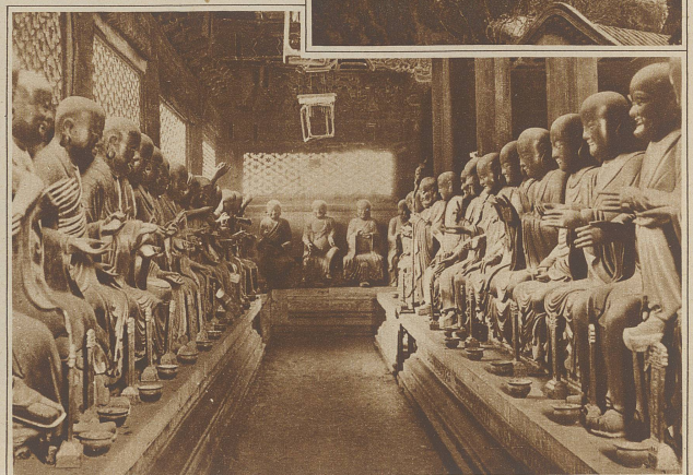
Einige der niedrigeren Götter im Tempel der 501 Götter in Peking