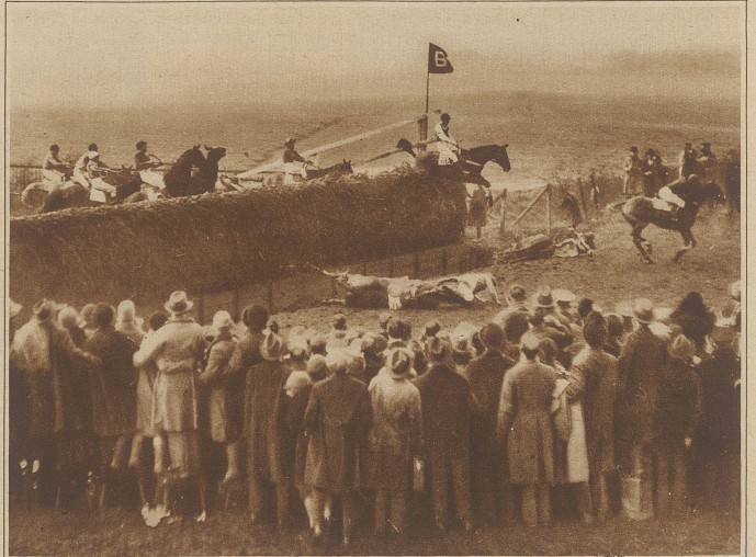
Das größte und schwierigste Pferderennen der Welt ist das alljährlich in Liverpool zum Austrag kommende GRAND NATIONAL, das am Freitag eine Besetzung von 42 Pferden aufwies, von welchen aber nur zwei ins Ziel einliefen; alle übrigen stürzten. Unser Bild zeigt zwei gefährliche Stürze an einer der ersten Hürden