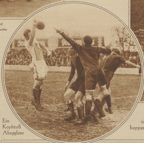
Ein Kopfstoß Abeggens