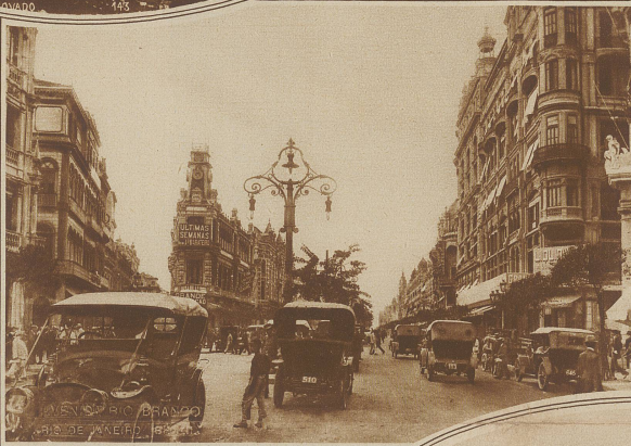
Das Leben auf der Avenida Rio Branco, einer Hauptstraße Rio de Janeiro

In einer Lage, die durch das Meer, die hügelige Bodengestaltung, den tropischen Reichtum an Pflanzen zauberhaften Reiz besitzt, ist Rio de Janeiro in eine Gegend gerückt, die auf den Besucher beglückend wirkt. Man nennt sie gerne die Stadt der Gegensätze, weil sich hier alle Vorteile der modernen Zivilisation neben den primitivsten Urvolkeneinrichtungen zeigen. Die Ausdehnung der Stadt ist gewaltig und sie erstreckt sich hauptsächlich der Bucht entlang in einer Weite von beinahe 20 Kilometern, die nur mit einer Tiefe von 3 Kilometern ins Land hineinreicht. Hier wohnen die 1 1/2 Millionen Einwohner, die ein reiches Gemisch von Eingeborenen und Ausländern bilden, die alle unter dem Schutze der freiesten Verfassung der Welt leben.