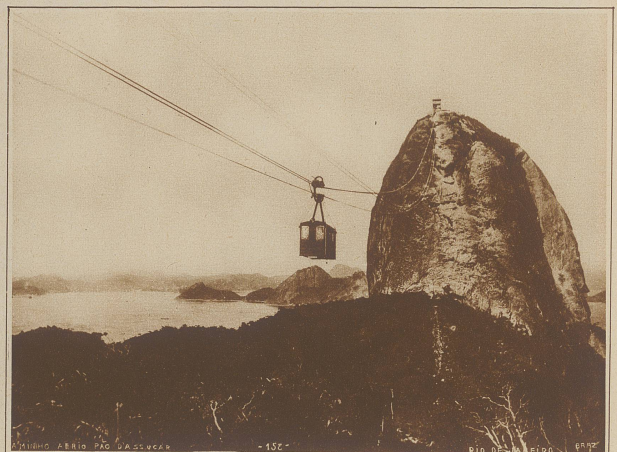
Die Seilschwebbahn auf den «Zuckerstock»