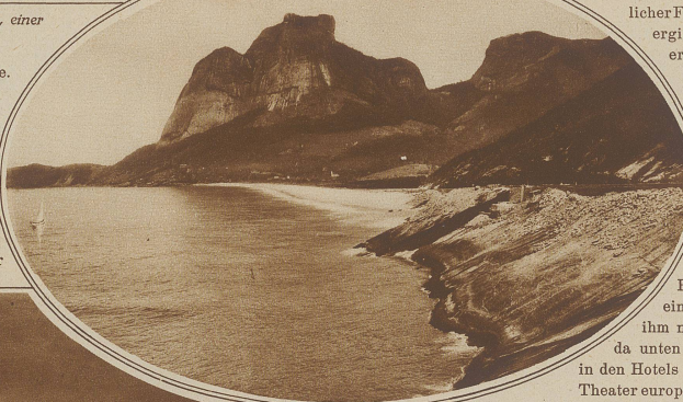
Malerisches Strandbild, aus der Umgebung von Rio de Janeiro

me der tropischen Sonne. Die Reichheit des Landes gibt allen die Lebensmöglichkeit ohne allzu anstrengende Arbeit. Nur deshalb kann hier auch der Schönheitssinn so sehr entwickelt sein. Man hat Zeit, sich an den Reizen der