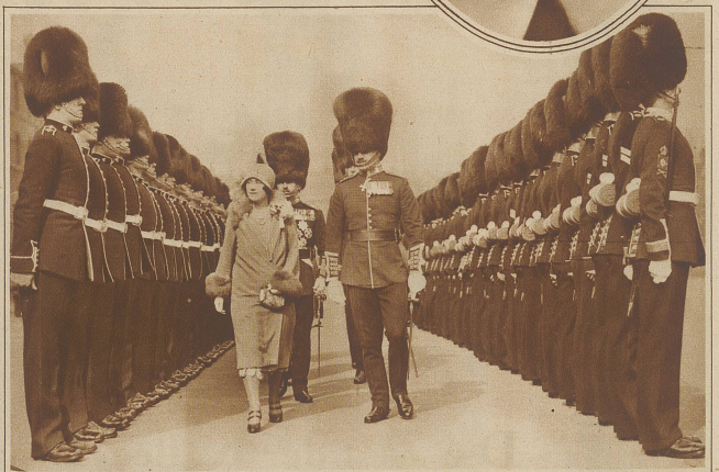
Inspektion englischer Gardisten durch die Prinzessin von York