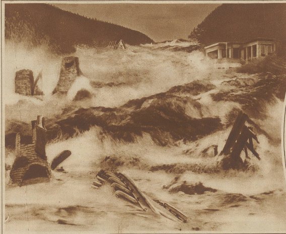
Die Dammbruchkatastrophe in Kalifornien, Zeichnung eines Augenzeugen

Bild links: Zum Zwischenfall auf dem «Royal Oak», dem Flaggschiff der englischen Mittelmeerflotte. Die drei Schiffe «Royal Oak», «Resolution» und «Revenge» vor Malta