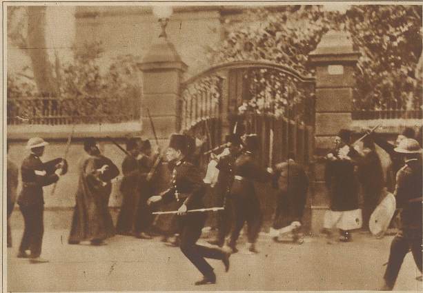
Zu den Unruhen in Kairo. Bild eines Straßenkampfes vor dem Palast Zaglul Paschas. Die Polizei versuchte revoltierende Studenten zu verhaften, wurde aber von der Menge daran gehindert und mit Steinen beworfen

Nicht nur die geladenen Gäste, sondern auch Braut und Bräutigam fahren auf Motorrädern zum Standesamt