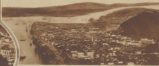
Blick auf die Stadt Santos mit dem eingestürzten Mont Serrat (rechts im Bilde). Das große Gebäude rechts am Fuße des Berges ist das nunmehr zerstörte Spital.

Die Bergsturzkatastrophe bei Santos (Brasilien). Am Sonntag stürzte ein großer Teil des in der Nähe der Stadt gelegenen Berges Serrat auf die Häuser von Santos. Das Spital Santa Casa de Misericordia wurde vollständig zerstört, ebenso einige in der Nähe stehende Privathäuser und eine Familienpension. Die Zahl der Opfer wird auf über 200 angegeben.