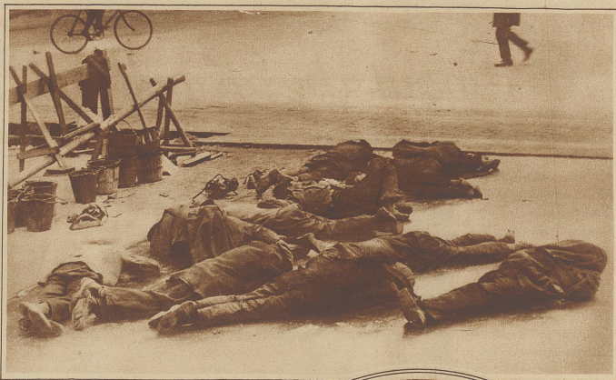
Nicht etwa eine Szene aus dem Bürgerkrieg in Kanton, sondern Asphaltarbeiter, die ihre Mittagspause auf einer Budapester Straße schlafend verbringen