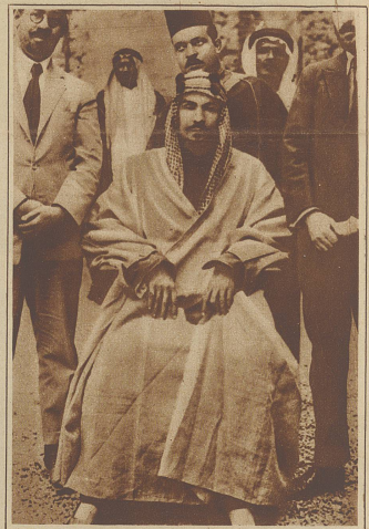
IBN SAÛT der geistige Führer der Aufständischen in Arabien

Eine selbst für amerikan. Verhältnisse etwas eigenartig anmutende Wahl ist in der Stadt Malden (Massachusetts) abgegangen, wo neben dem offiziellen Kandidaten in letztem Augenblick durch einige Spaßvögel ein Landstreicher als Bürgermeister vorgeschlagen wurde. Und siehe — der Mann wurde zum nicht geringen Schrecken selbst solcher, die ihm ihre Stimme gaben, gewählt. Die erste Amtshandlung spielte darin, daß er sämtliche Wähler abscheu und Fremde und „Strandgenossen“ an ihre Stelle setzte. Das Bild zeigt den Bürgermeister beim Frühstück.