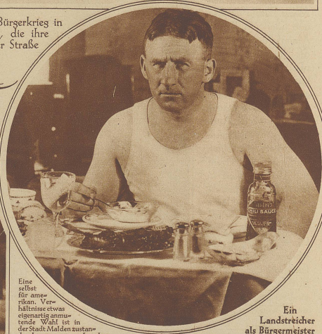
Ein Landstreicher als Bürgermeister

Eine selbst für amerikan. Verhältnisse etwas eigenartig anmutende Wahl ist in der Stadt Malden (Massachusetts) abgegangen, wo neben dem offiziellen Kandidaten in letztem Augenblick durch einige Spaßvögel ein Landstreicher als Bürgermeister vorgeschlagen wurde. Und siehe — der Mann wurde zum nicht geringen Schrecken selbst solcher, die ihm ihre Stimme gaben, gewählt. Die erste Amtshandlung spielte darin, daß er sämtliche Wähler abscheu und Fremde und „Strandgenossen“ an ihre Stelle setzte. Das Bild zeigt den Bürgermeister beim Frühstück.