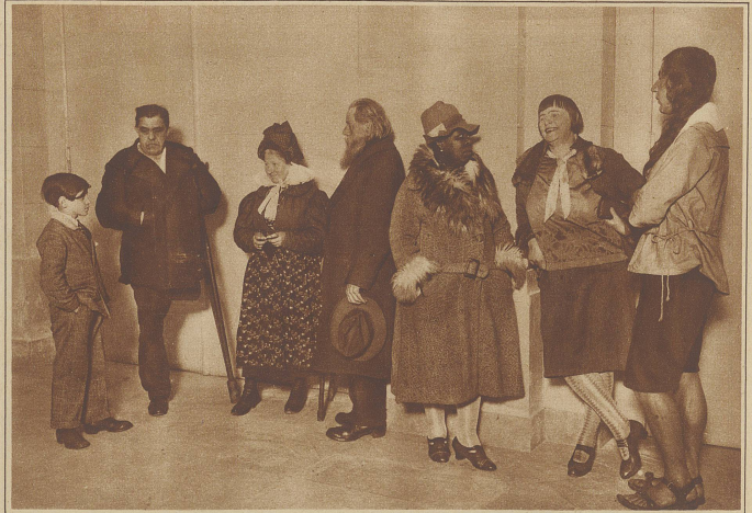
Der Markt der Modelle. Eine interessante, kunterbunt zusammengewürfelte Gesellschaft versammelt sich jeden Montag in der Berliner Akademie der Künste, um sich Malern und Bildhauern als Modell zu verkaufen und so ein paar Mark für den Lebensunterhalt zu verdienen.