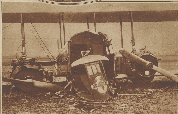
Flugzeugabsturz in England. In der Nähe des Flughafens von Lympne stürzte ein großes französisches Verkehrsflugzeug ab, wobei die Maschine vollständig in Trümmer ging. Wie durch ein Wunder kamen die 10 Passagiere mit dem Leben davon.

Das dem Bergsturz zum Opfer gefallene Spital Santa Casa de Misericordia, unter dessen Trümmern allein gegen 80 Kranke den Tod fanden.