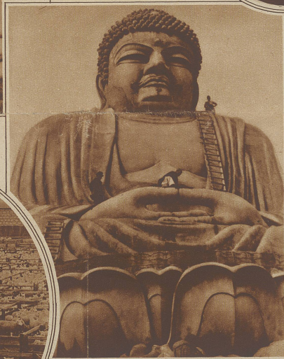
Die größte Buddhastatue der Welt wurde kürzlich in Beppu (Japan) errichtet. Sie ist gegen 30 Meter hoch. Als Maßstab für die Größenverhältnisse dienen am besten die winzigen Figuren der Arbeiter, die auf der Statue herumklettern