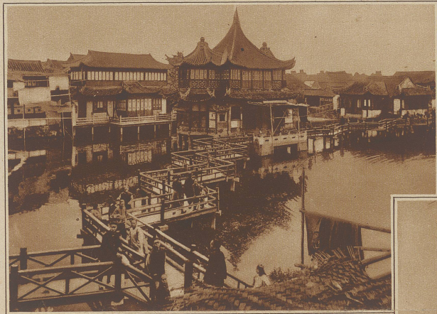
Eine eigenartige Zick-Zack-Brücke in der Chinesenstadt Schanghai