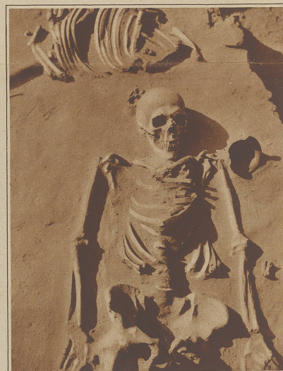
Der Mensch der Urzeit. Bei den Arbeiten am Djebel-Kraflwerk wurden wichtige archaische Ausgrabungen gemacht. So fand man u. a. ein vollständig erhaltenes Menschen skelett, das neben einem Pferd begraben war und vermutlich einige Tausend Jahre alt ist. Auffallend sind die unverhältnismäßig langen Arme