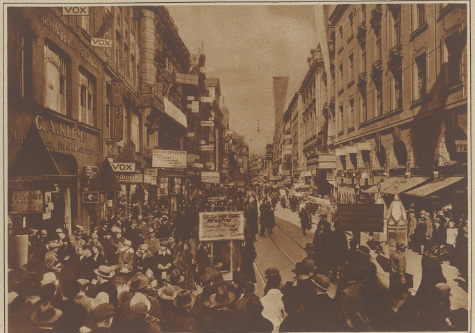
Messebetrieb auf dem Neumarkt in Leipzig während eines der Haupttage