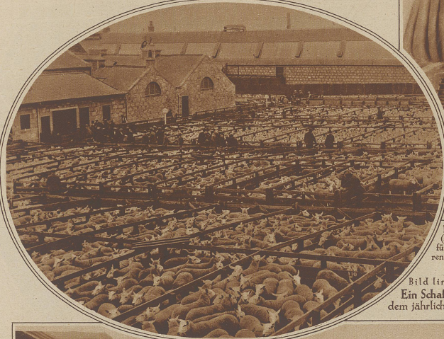
Ein Schafmarkt in Schottland. 16.000 Schafe warteten auf dem jährlichen Markt in Kittybrewster auf ihre Käufer