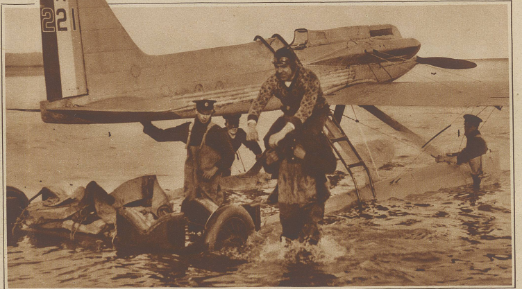
Der bekannte englische Flieger Kinkead stürzte beim Versuch, den Geschwindigkeits-Weltrekord zu schlagen, ins Meer und ertrank. Schon am Samstag zwang ihn ein Körperstich zu einer Notlandung, die, wie unser Bild zeigt, glücklich verlief. Beim nächsten Versuch am Montag erreichte ihn das Schicksal