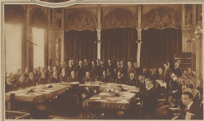
Eine Sitzung aus der gegenwärtigen Session des Völkerbundsrates in Genf