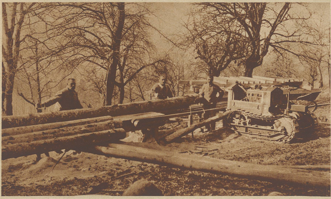
Der Traktor als Fräsmaschine; eine Erfindung, die es auch kleineren landwirtschaftl. Betrieben ermöglicht, den Traktor vor allem im Winter besser auszunützen