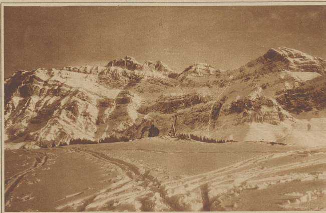
Uebersicht über den Absturz. Der Pfeil zeigt die Absturzhöhe von etwa 500 Metern