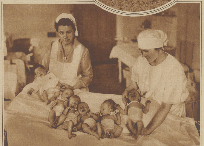
Sie werden nur alle vier Jahre Geburtstag haben. Eine Gruppe junger Erdenbürger, die am 29. Februar in einer Frauenklinik das Licht der Welt erblickten