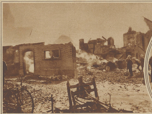
Blick auf die Brandruinen

Links: Maxim Gorki, der bekannte russische Schriftsteller, wird diesen Monat 60 Jahre alt