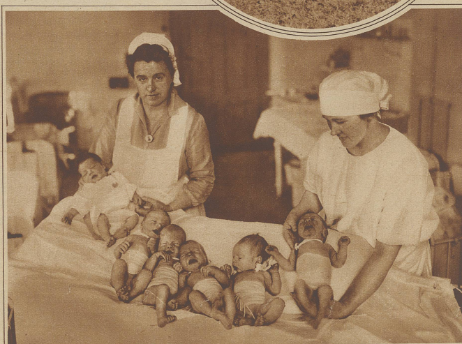
Sie werden nur alle vier Jahre Geburtstag haben. Eine Gruppe junger Erdenbürger, die am 29. Februar in einer Frauenklinik das Licht der Welt erblickten