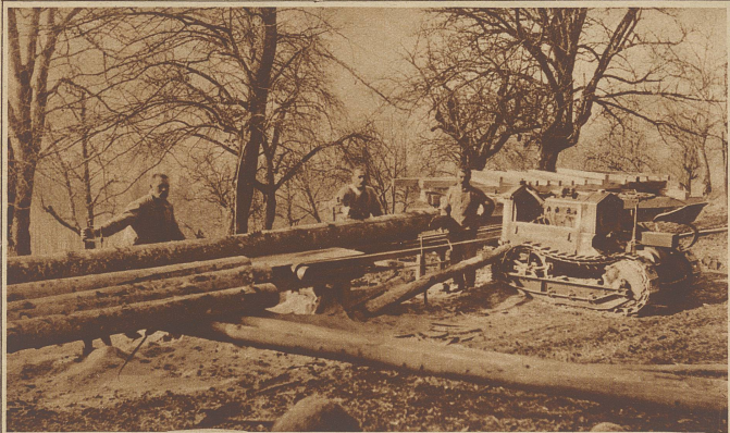
Der Traktor als Fräsmaschine; eine Erfindung, die es auch kleineren landwirtschaftl. Betrieben ermöglicht, den Traktor vor allem im Winter besser auszunützen