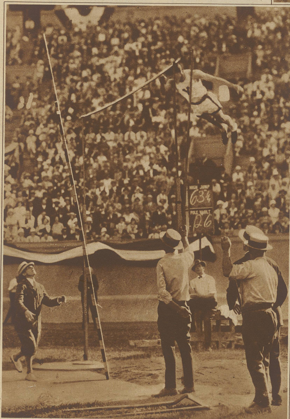
Neuer Stabhochsprung-Weltrekord. Der ausgezeichnete amerikanische Stabhochspringer Carr verbesserte in New York den Weltrekord auf die labelhafte Höhe von 4,29 Meter.