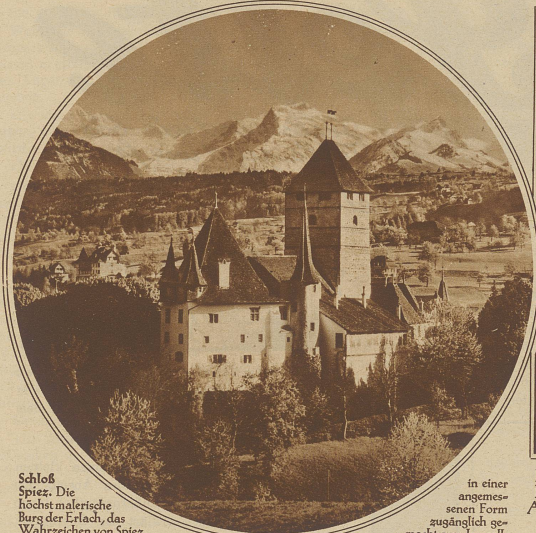
Schloß Spiez. Die höchst malerische Burg der Ertach, das Wahrzeichen von Spiez, ist von der Gefahr bedroht, durch Parzellierung schwer geschädigt oder teilweise sogar niedergelegt zu werden. Zur Rettung der Burg, die der Öffentlichkeit

in einer angenehmen Form zugänglich gemacht werden soll, hat sich ein bernisches Komitee gebildet. Die Auktion zur Erhaltung des Schlosses verdient weiteste Unterstützung der Öffentlichkeit