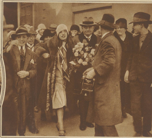
Die bekannte Filmschauspielerin Lily Damita wurde bei ihrer Ankunft in Bern stürmisch begrüßt

in einer angenehmen Form zugänglich gemacht werden soll, hat sich ein bernisches Komitee gebildet. Die Auktion zur Erhaltung des Schlosses verdient weiteste Unterstützung der Öffentlichkeit