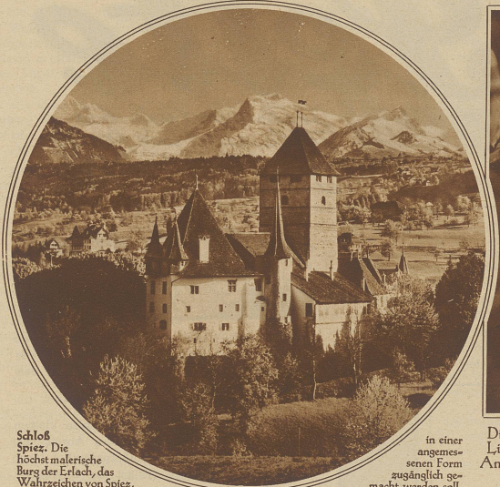
Schloß Spiez. Die höchst malerische Burg der Ertlach, das Wahrzeichen von Spiez, ist von der Gefahr bedroht, durch Parzellierung schwer geschädigt oder teilweise sogar niedergelegt zu werden. Zur Rettung der Burg, die der Öffentlichkeit

in einer angemessenen Form zugänglich gemacht werden soll, hat sich ein bernisches Komitee gebildet. Die Auktion zur Erhaltung des Schlosses verdient weiteste Unterstützung der Öffentlichkeit