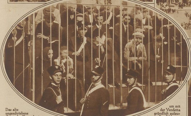
Das alte ungeschriebene Gesetz der Blutrache in Italien verschwindet, jetzt und die italienische Regierung hat alle Maßnahmen ergriffen,

um mit der Vendetta gründlich aufzu- räumen. Das Bild zeigt sizilianische bewachte Ge- fangene, die in einen Fall von Vendetta verwickelt sind