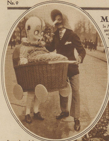
Fastnachtstrubel am Karlstor. Der Wagen mit dem Anti-Alkoholdrachen

In München wurde zum ersten Male seit Kriegsende wieder der echte Münchner Karneval be- gangen. Leider kam es am Faschingsmontag zu Zusammenstößen zwischen Polizei und Zu- schauermenge. Die Polizei mußte vom Gummiknüffel Gebrauch machen und Verhaftungen vornehmen. Die Sanität soll 174 Personen aus dem Gedränge gebracht und 80 Menschen schwere Ohnmachtsfälle erlitten haben