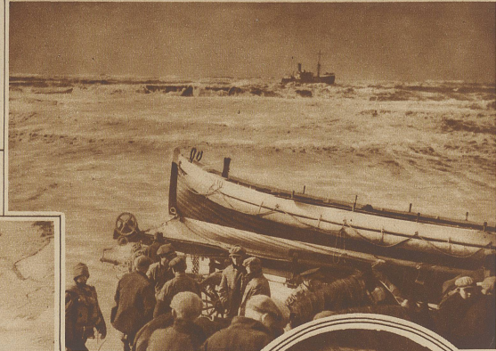
Infolge des heftigen Sturmes strandete vor Ymuden der englische Dampfer «Shonga» und zerbrach in zwei Teile