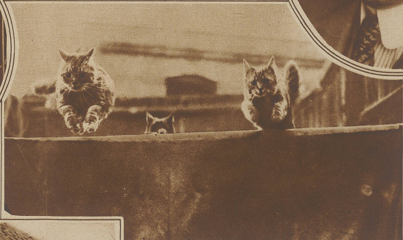
Links: Ein Hindernisrennen für Katzen in London

um mit der Vendetta gründlich aufzu- räumen. Das Bild zeigt sizilianische bewachte Ge- fangene, die in einen Fall von Vendetta verwickelt sind