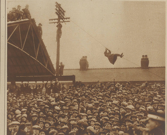
Bei einem Fußballmatch in England, der vor der riesigen Zuschauermenge von 47 000 Menschen in Lei- cester zwischen Leicester City und Tottenham Hotspur ausgetragen wurde, erkletterten einige allzu be- geisterte Sportsfreunde sogar die Telegraphenleitung, um aus luftiger Höhe das Spiel verfolgen zu können