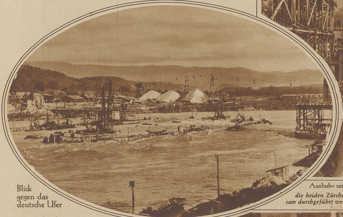
Blick gegen das deutsche Ufer