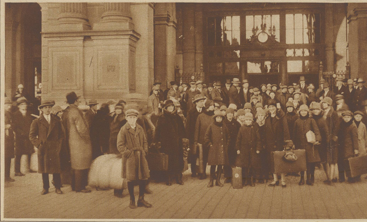
Der russische Staatschor vor dem Hauptbahnhof in Zürich Was die Woche Neues bringt