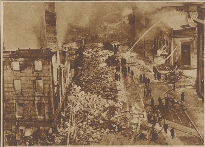
Stadt in Flammen. Eine riesige Brandkatastrophe, die einen ganzen Stadtteil in Trümmer legte, ereignete sich kürzlich in Fall Rive (Mass.)