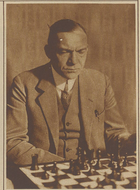
Der schweizerische Schachmeister Johner klassierte sich im internationalen Großmeisterturnier in Berlin als Vierter