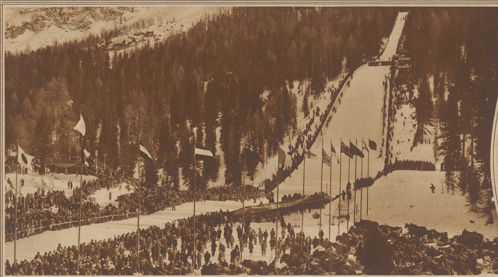
Die Olympia-Schanze während des großen Sprunglaufes, dem gegen 10,000 Zuschauer beiwohnten

Im Oval: Thullin Thams, der olympische Sprunglaufsieger des Jahres 1924, erreichte in St. Moritz die Rekord-Sprunglänge von 73 m, stürzte jedoch beim Niedersprung