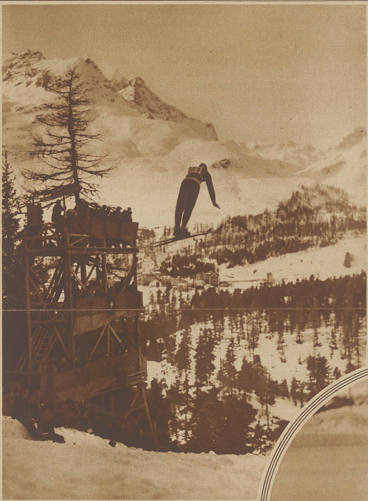
Ein prächtiger 64 m Sprung des Siegers Alf Andersen, Norwegen

Im Kreis: Grafström, Schweden, blieb im Herren-kunstlaufen knapper Sieger vor dem Oesterreicher Böckl