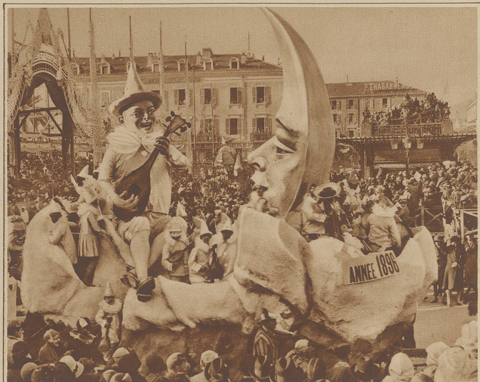
Karneval in Nizza. Ein Ausschnitt aus dem diesjährigen Umzug