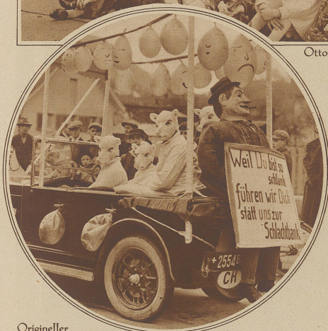
Origineller Wagen aus dem diesjährigen Fritschiumzug in der Leuchtenstadt