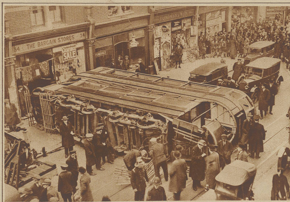
Durch das Umstürzen einer Trambahn in Balham (England) wurden 10 Personen schwer verletzt