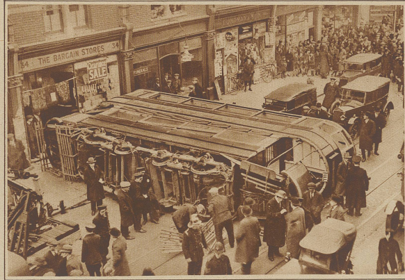
Durch das Umstürzen einer Trambahn in Balham (England) wurden 10 Personen schwer verletzt