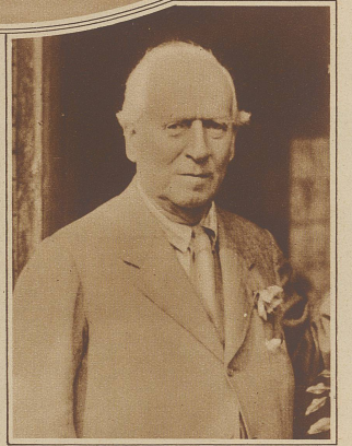
Graf Oxford and Asquith, der bekannte Staatsmann und große liberale Führer Englands, ist am vergangenen Mittwoch, morgens 6.50 Uhr, 75jährig gestorben