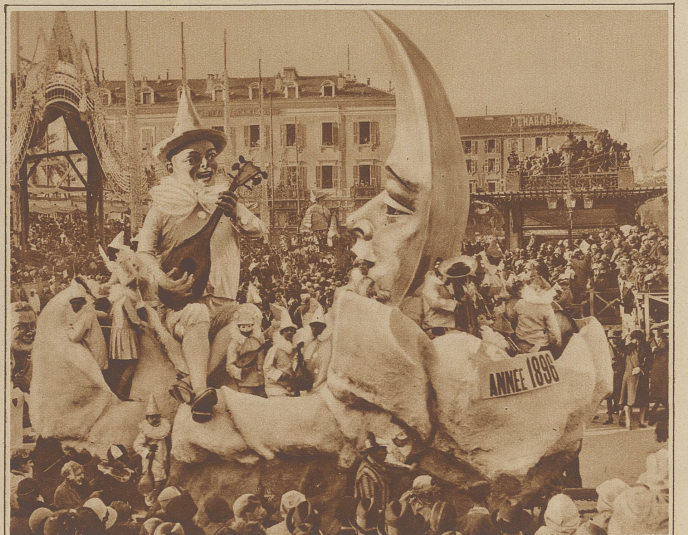
Karneval in Nizza. Ein Ausschnitt aus dem diesjährigen Umzug