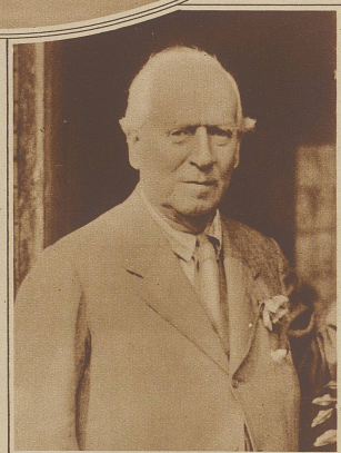
Graf Oxford and Asquith, der bekannte Staatsmann und große liberale Führer Englands, ist am vergangenen Mittwoch, morgens 6.50 Uhr, 75jährig gestorben