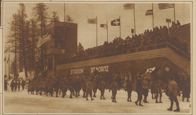
Aus dem Vorübermarsch der Nationen, anlässlich der Eröffnungsfeier. Im Vordergrund Italien