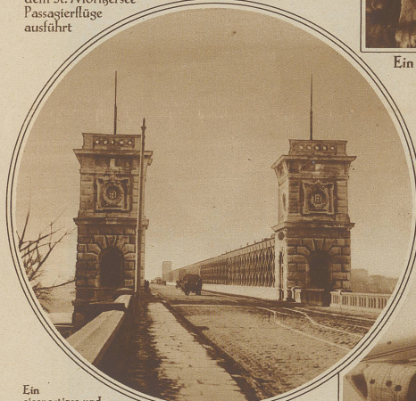
Ein eigenartiges und trauriges Jubiläum

Kann die Reichsbrücke in Wien begehen. Eine Statistik der Wiener Polizei hat festgestellt, daß sich kürzlich der tausendste Selbstmörder von ihrem Geländer in die Fluten der Donau gestürzt hat. Die Wiener Polizei, die gegen diese Verlebe der Selbstmörder machtlos ist, will jetzt auf dem Geländer eine elektrische Leitschiene anbringen lassen, die jeder berühren muß, der sich darüber in das Wasser stürzen will. Der Strom wird so reguliert, daß er erschreckt, aber nicht tötet