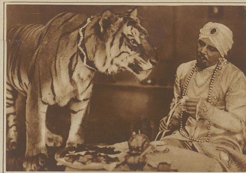
Ein unheimlicher Tischgast. Der Sensationsfilmdarsteller Harry Piel mit seinem liebtingtiger Baylard