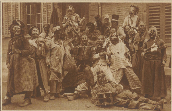
Eine Gruppe origineller Flumser Buhi beim Fastnachtstreiben, das sich in dieser Gegend noch in den Formen hundertjähriger Tradition erhalten hat