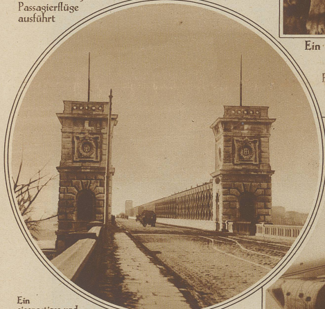
Ein eigenartiges und trauriges Jubiläum

Kann die Reichsbrücke in Wien begehen. Eine Statistik der Wiener Polizei hat festgestellt, daß sich kürzlich der tausendste Selbstmörder von ihrem Geländer in die Fluten der Donau gestürzt hat. Die Wiener Polizei, die gegen diese Verliebe der Selbstmörder machtlos ist, will jetzt auf dem Geländer eine elektrische Leitschiene anbringen lassen, die jeder berühren muß, der sich darüber in das Wasser stürzen will. Der Strom wird so reguliert, daß er erschreckt, aber nicht tödtet