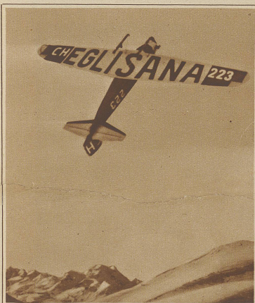
Das mit Riesenlettern versehene Reklameflugzeug, das bis zum Schluß der Olympiade täglich mit Start auf dem St. Moritzersee Passagierflüge ausführt