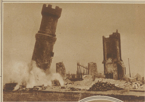
Bild rechts: Sprengung eines 60-m hohen Turmes der Eisenbahnwerkstätte in Boston (Mass.), die einem neu zu errichtenden Stadion weichen mußte