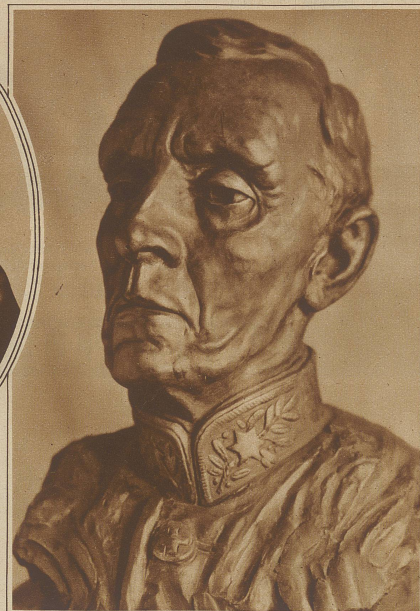
Eine von Bildhauer K. Schenk in Bern ausgeführte Sprecherbüste