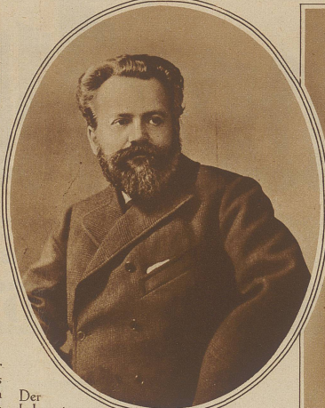
Der bekannte Schriftsteller Carl Bleibtreu ist in Locarno im Alter von 69 Jahren an den Folgen eines Herzschlages gestorben