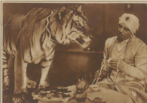
Ein unheimlicher Tischgast. Der Sensationsfilmdarsteller Harry Piel mit seinem Lieblingstiger Bayland