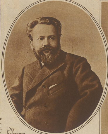
Der bekannte Schriftsteller Carl Bleibtreu ist in Locarno im Alter von 69 Jahren an den Folgen eines Herzschlages gestorben