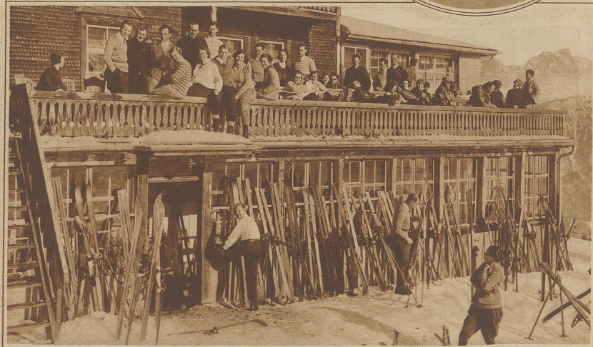
Ski-Sonntag auf den Flumserbergen