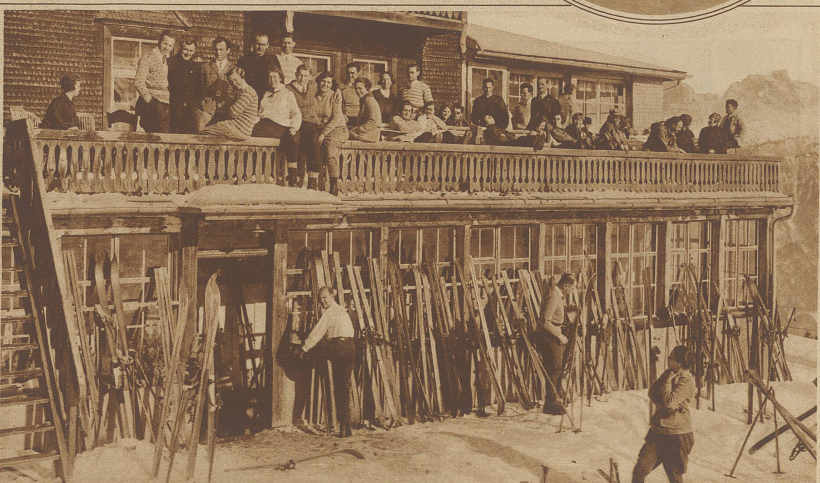
Ski-Sonntag auf den Flumserbergen