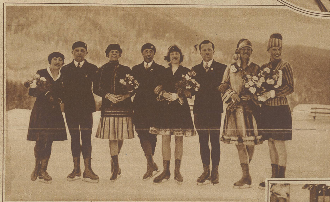
Deutschlands Eislaufmannschaft für die Olympiade bei einem Schaufahren in Pontresina