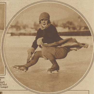
Bild rechts: Die erst 16jährige Inhaberin der Damenweltmeisterschaft im Kunstlaufen, Sonja Henne (Oslo) wird voraussichtlich auch die olympische Konkurrenz in St. Moritz gewinnen

Der Bob-Fraus mit Führer Möllers, der die schweizer Bobsteuermannschaft gewann und nun zusammen mit den Bobe Stoffel (Arosa) und Schmid (Arosa) die Schweiz zu den olympischen Rennen vertreten wird