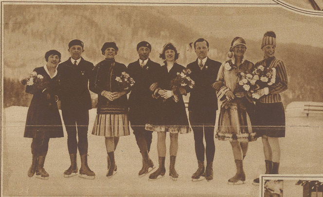
Deutschlands Eislaufmannschaft für die Olympiade bei einem Schaufahren in Pontresina