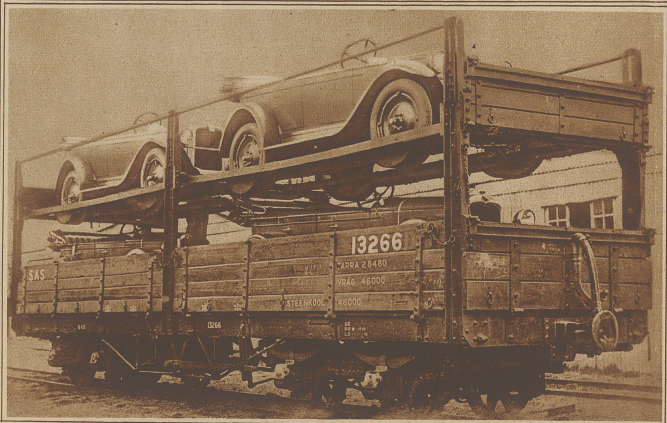
Zweistöckige Güterwagen sind auf den südafrikanischen Bahnliniten mit Erfolg ausprobiert und eingeführt worden

Rebellen Nicaraguas übergaben ihre Gewehre den Marinesoldaten der Vereinigten Staaten