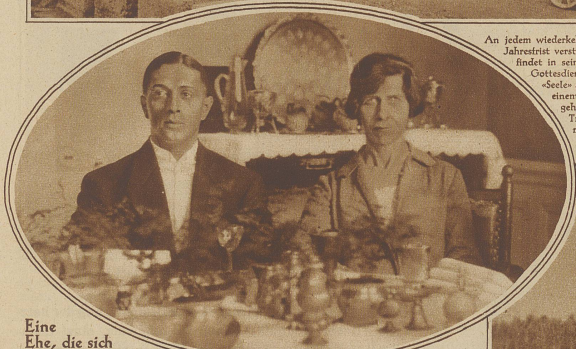
Eine Ehe, die sich nicht bewährt hat.