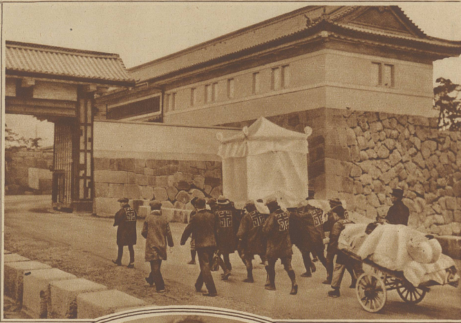
An jedem wiederkehrenden Todestag des vor Jahresfrist verstorbenen Kaisers von Japan findet in seinem ehemaligen Palast ein Götterdienst statt, zu welchem seine «Seele» aus der Paulowihalle auf einem einfachen Karren herbeigeholt wird. Voran schreiten Träger mit dem Altar, der mit einem weißen Tuch bedeckt ist.