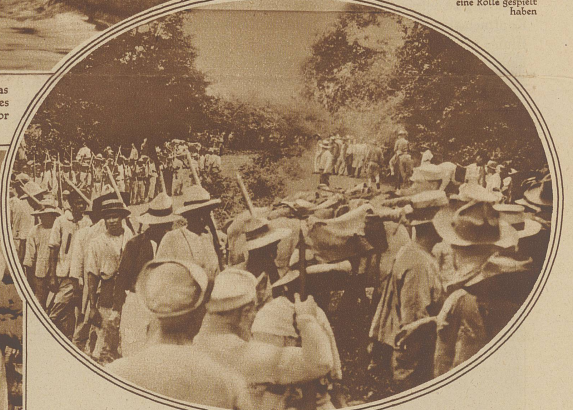
Zum Abschluß des Aufstandes in Nicaragua

Rebellen Nicaraguas übergaben ihre Gewehre den Marinesoldaten der Vereinigten Staaten