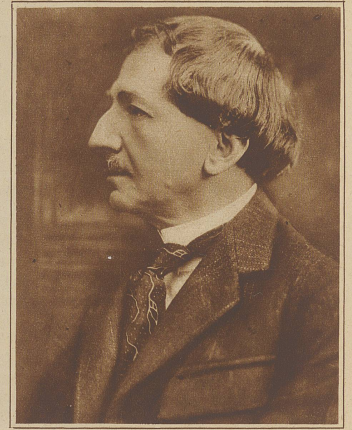
Gegen Dr. Juvara, den Leibarzt des verstorbenen Königs von Rumänien, ist die schwere Anklage erhoben worden, daß er durch gewissenlose Behandlung und mangelndes ärztliches Können das Leben des Königs um mehrere Jahre gekürzt habe. Persönliche Interessen sollen dabei eine Rolle gespielt haben