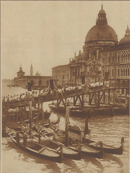
Malerische Prozession der Bevölkerung Venedigs zur Kirche Madonna della Salute über eine besonders für dieses Kirchenfest errichtete Brücke