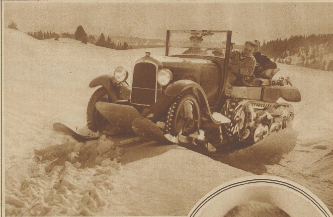
Ein neues Raupenauto für den Winterverkehr auf den Alpenstraßen