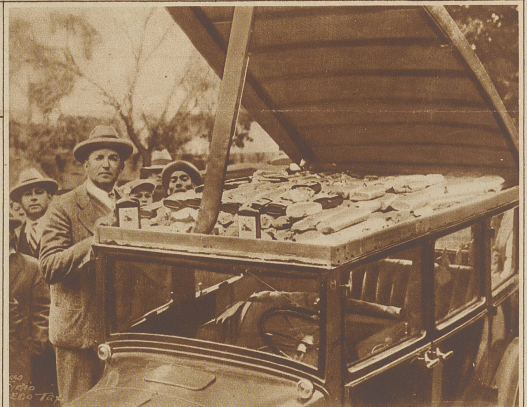
Wie sich das trockene Amerika mit Silverlikören versorgen wollte. Immer neue Tricks müssen erfunden werden, um die verbotenen Getränke herbeizuschuggeln. Ein von den Zollbehörden in Texas beschlagnahmtes Auto, dessen Verdeck, wie unser Bild zeigt, als Versteck für den Rumschmuggel diente