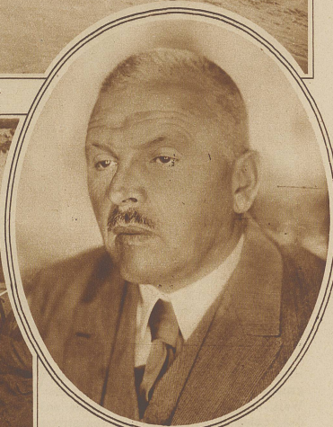
Der deutsche Reichswehrminister Dr. Geßler ist von seinem Amt zurückgetreten