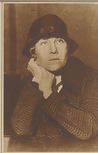
Frau Ruth Snyder und ihr Geliebter Henry Gray, die zusammen den Gatten der Frau Snyder ermordeten, sind letzte Woche auf dem elektrischen Stuhl hingerichtet worden