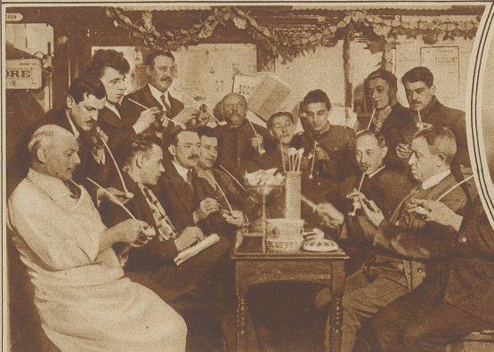
Ein eigenartiger Wettbewerb wurde in Brüssel durchgeführt. Sieger wurde derjenige, welcher an einer mit 3 Gramm Tabak gefüllten Pfeife am längsten rauchte, ohne daß das Feuer ausging. Der Sieger brachte es auf 1 Stunde 8 Minuten