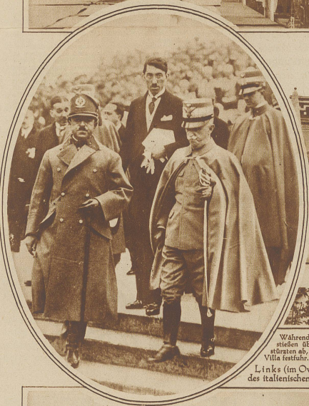
Während der Luftmanöver zu Ehren des Königs von Afghanistan stießen über der Stadt Rom zwei Militärflugzeuge zusammen und stürzten ab, wobei der eine der beiden Apparate sich auf dem Dach einer Villa festhielt. Die Piloten wurden gerettet. Links (im Oval): Der König von Afghanistan (links) als Gast des italienischen Königs in Rom