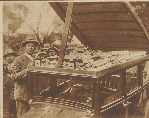
Wie sich das trockene Amerika mit Silversterlikören versorgen wollte. Immer neue Tricks müssen erfunden werden, um die verbotenen Getränke herbeizuschmuggeln. Ein von den Zollbehörden in Texas beschlagnahmtes Auto, dessen Verdeck, wie unser Bild zeigt, als Versteck für den Rumschmuggel diente