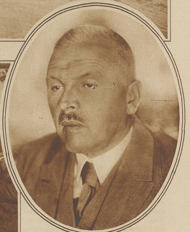
Der deutsche Reichswehrminister Dr. Geßler ist von seinem Amt zurückgetreten