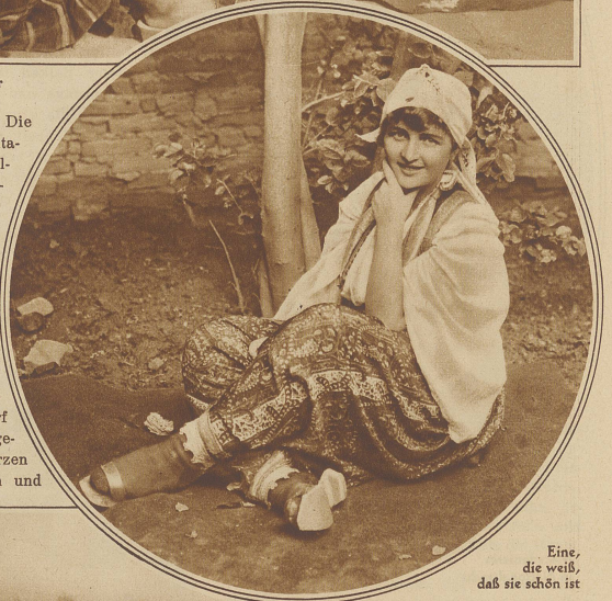
Eine, die weiß, daß sie schön ist

Nationalitätenstreits. Die ausgesprochensten Antagonisten sind die Bulgaren, Serben und Griechen. In den Küstengebieten hausen vorwiegend Griechen und im Innern des Landes herrscht das slowenische Volkselement vor. Eine eigene Volksklasse bilden noch die Zigeuner, die nach Nomadenart von Dorf zu Dorf ziehen, wo es ihnen gerade paßt ihre schwarzen Zeltlager aufschlagen und