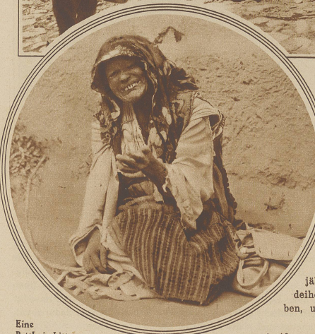
Eine Bettlerin bittet um ein Almosen

Spitze Gipfel fehlen zwar. Grasbewachsene, kuppelige Formationen krönen die Berge, die zum Teil eine Höhe von 2000 Metern weit übersteigen. Nach beiden Seiten fällt das Gebirge ab. Nur allmählich nach Norden, sehr rasch aber nach Süden. Dadurch sind auch die großen Unterschiede in den klimatischen Verhältnissen bestimmt. Diese Unterschiede treten namentlich im Frühjahr stark in Erscheinung. Im Sommer ist das ganze Gebiet schneefrei. / Die Vegetation ist zum Teil eine durchaus südliche. Verschiedene Ernten können sogar zweimal jährlich eingeheimst werden. Vorzüglich gedeihen Mais, Tomaten, Melonen, Paprika, Trauben, und zu eigentlicher Berühmtheit sind die herrlichen Rosenpflanzungen gelangt. Die Bewässerung der bepflanzen Gebiete ge-