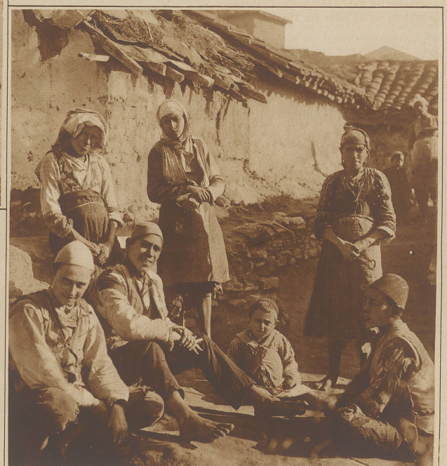
Im Türkenviertel von Uesküb