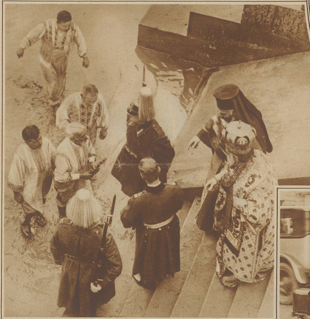
In Rumänien wird nach altem Brauch alljährlich das Fest der Wasserweihe feierlich begangen. Das Bild zeigt, wie ein Kreuz, das die Wasserweihe empfangen hat, dem Prinzen Nicholas (in Uniform ohne Mütze) überreicht wird. Hinter dem Prinzen der Patriarch von Rumänien, Miron Christea