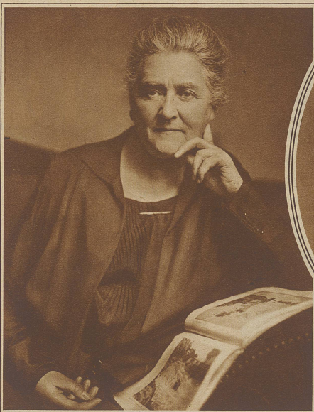
Lisa Wenger, die weit über die Grenzen unseres Landes hinaus bekannte und geschätzte Schriftstellerin, feiert heute ihren 70. Geburtstag