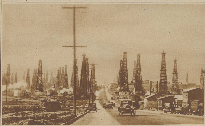
Ein Wald der Technik. Blick auf ein Feld von Petroleum-Bohrtürmen in der Nähe von Los Angeles