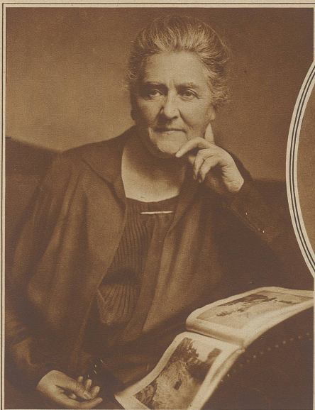
Lisa Wenger, die weit über die Grenzen unseres Landes hinaus bekannte und geschätzte Schriftstellerin, feiert heute ihren 70. Geburtstag