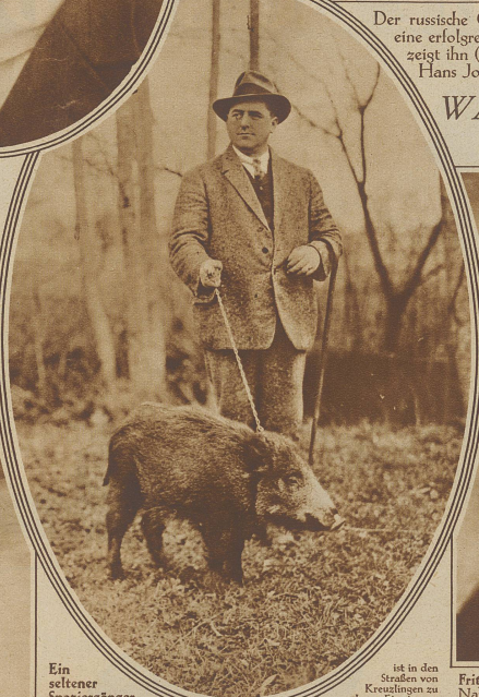
Ein seltener Spaziergänger

etwa 7 Wochen gefangen und mit der Milchflasche aufgezogen wurde. Das Tier scheint mit dem neuen Leben sehr zufrieden zu sein und verschlingt kleine ihm gebotene Leckerbissen mit freudigem Grollen