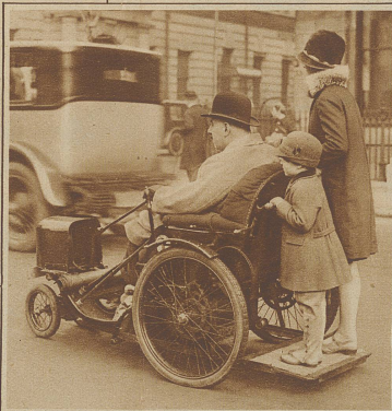
Ein neuer Krankensstuhl mit elektr. Antrieb. Auf diese Weise ist es dem im Bilde ersichtlichen engl. Parlamentsmitglied Major Cohan möglich, mühelos zu den Sitzungen zu fahren. Hinten auf der Plattform stehen als Passagiere seine beiden Kinder