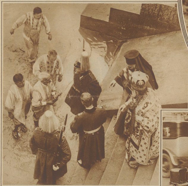
In Rumänien wird nach altem Brauch alljährlich das Fest der Wasserweihe feierlich begangen. Das Bild zeigt, wie ein Kreuz, das die Wasserweihe empfangen hat, dem Prinzen Nicholas (in Uniform ohne Mütze) überreicht wird. Hinter dem Prinzen der Patriarch von Rumänien, Miron Christea