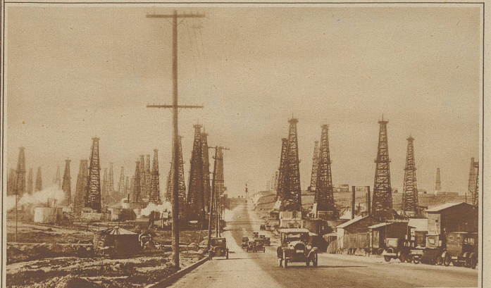
Ein Wald der Technik. Blick auf ein Feld von Petroleum-Bohrtürmen in der Nähe von Los Angeles