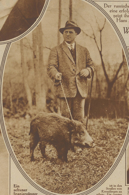
Ein seltener Spaziergänger

vor 7 Wochen gefangen und mit der Milchflasche aufgezogen wurde. Das Tier scheint mit dem neuen Leben sehr zufrieden zu sein und verschlingt kleine ihm gebotene Lederbissen mit freudigem Grollen