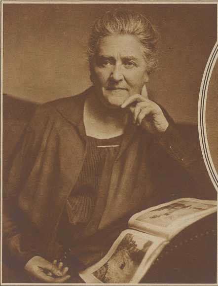
Lisa Wenger, die weit über die Grenzen unseres Landes hinaus bekannte und geschätzte Schriftstellerin, feiert heute ihren 70. Geburtstag