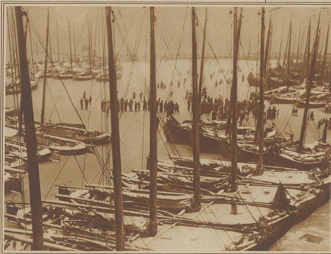
Ein eingefrorener holländischer Fischerhafen. Die zur Untätigkeit verurteilten Fischer liegen dem Eislauf ob