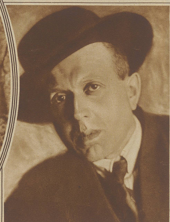
Frig Platten, ehemaliges kommunistisches Mitglied des schweiz. Nationalrates, soll sich nach Pressemeldungen ebenfalls unter den durch die Sowjetregierung nach Sibirien verbannten Oppositionsführern befinden

ist in den Straßen von Kreuzlingen zu sehen: Ein junges Wildschwein, das vor