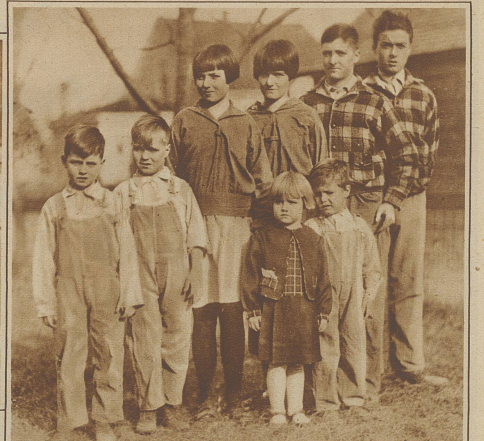
Ein Zwillingquartett. Die Familie Koger in Omaha, Nebraska, ist mit 4 Zwillingpaaren gesegnet und hat außerdem noch 4 weitere Kinder. Das Bild zeigt die Stufenleiter der Zwillinge