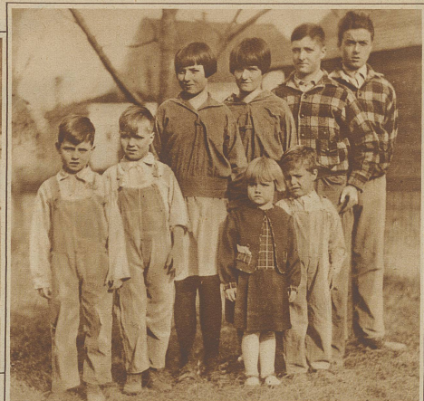
Ein Zwillingquartett. Die Familie Koger in Omaha, Nebraska, ist mit 4 Zwillingenpaaren gesegnet und hat außerdem noch 4 weitere Kinder. Das Bild zeigt die Stufenleiter der Zwillinge