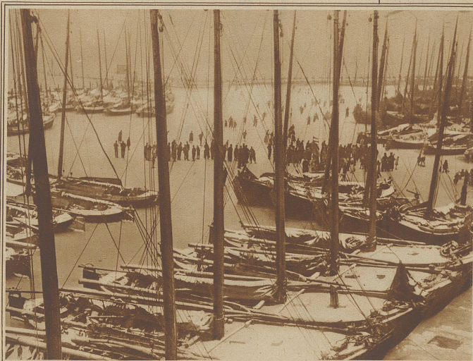
Ein eingefrorener holländischer Fischerhafen. Die zur Untätigkeit verurteilten Fischer liegen dem Eislauf ob