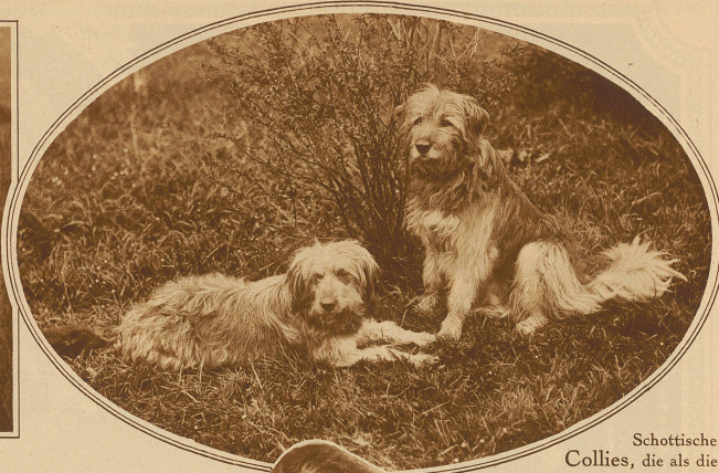
Schottische Collies, die als die geschicktesten Hunde gelten