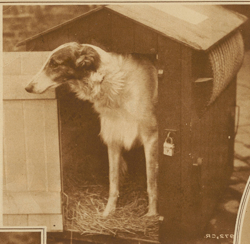
Barzoy in praktischer und zweckmässiger Hütte