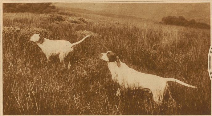
Pointers an der Arbeit