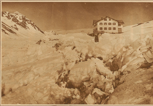
Eine ungewöhnliche Lawine ging auf dem Flüßpaß von der Schwarzhornseite nieder. Sie hat den zugefrorenen See in seiner ganzen Länge eingeschlagen und das Eis auf der Seite gegen das Hospiz hin bis zu 25 Meter auf das Ufer hinaufgeworfen. Unser Bild zeigt die mächtigen Eisschollen mit dem Flüßhospiz.