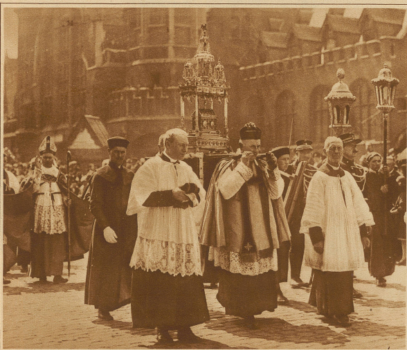
Der goldene Reliquienschrein in der Prozession. Dahinter: Der Erzbischof von Malines segnet die Menge