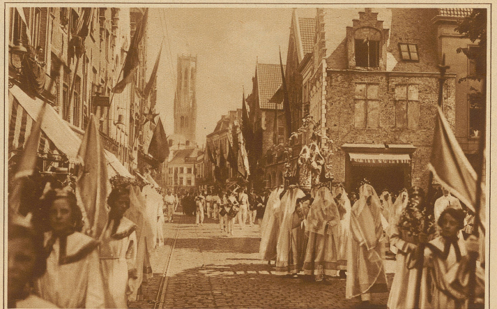
Aus der großen Prozession des «Heiligen Blutes» in Bruges