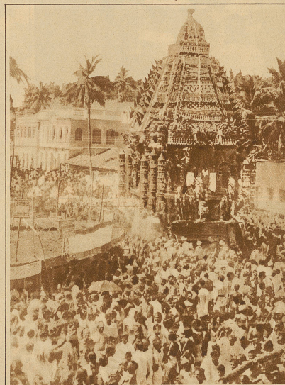
Bild rechts: Tausende frommer Hindus nehmen an dem alljährlich gefesteten Sri Kabeleswarar-Tempel fest teil. Ein großer, prunkvoller Tempelwagen wird in der Prozession durch die Straßen von Myslapore geführt.