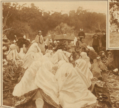
Ein eigenartiger religiöser Brauch. Klageweiber auf einem Friedhof in Tunis. Die Frauen beten gegen geringe Bezahlung und klagen an den Gräbern der reichen Toten.