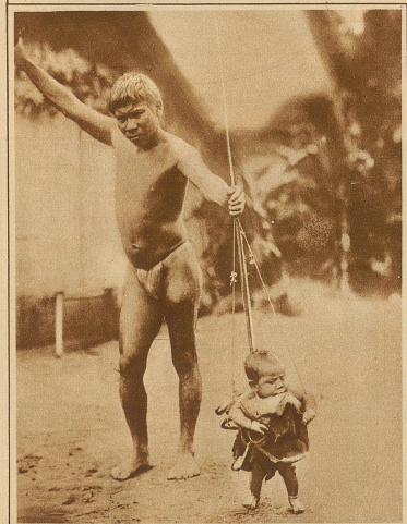
Wie Indianerkinder gehen lernen? Ein Eingeborener vom Amazonenstrom, der seinem Jüngsten in einem selbstverfertigten, primitiven Gehstuhl die ersten Schritte beibringt.