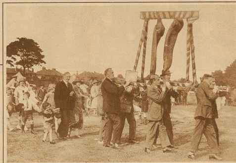
Prämierung des glücklichsten Ehepaares in England. Gemäß einer alten Sitte wurde auch dieses Jahr wieder das glücklichste Ehepaar im ganzen Lande, das viele Kinder hat, niemals streitet und sich niemals zankt, und wo auch sonst alles in Ordnung ist, durch einen Sondergerichtshof ausgezeichnet. Wie unser Bild zeigt, erhielt es als Preis zwei halbe Schweine, die in feierlicher Prozession über den Grandstapfen getragen wurden, gefolgt von dem glücklichen Paar mit seinen 10 Kindern. Ob sie sich wirklich nie gezankt haben...