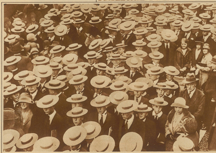
Strohuttreklame? Nein, aber das Bild einer Versammlung von Zöglingen einer englischen Schule, die als Abzeichen im Sommer diese Strohhüte tragen