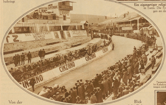
Von der diesjährigen Targa Florio