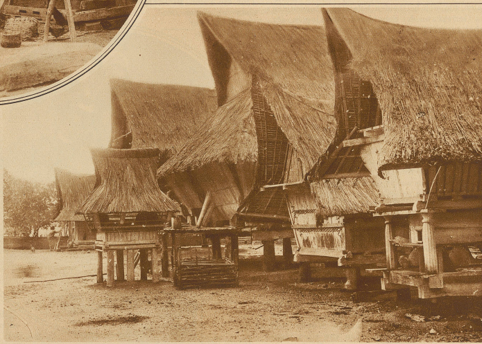
Karo-Batak Häuser im Sibulangeit.

Kehrichts und der Abfälle dient. Zu diesem Zweck ist der Fußboden zu beiden Seiten nach der Mitte geneigt, während in der Rinne selbst ein nur 30 cm breites Brett als Laufplanke mit so breiten beiderseitigen Fugen liegt, daß aller Unrat sofort durchfallen kann. / Ein aufrechtes Gehen, ohne sich den Kopf an einem der Querbalken zu stoßen, ist unmöglich. Zu beiden Seiten befinden sich unmittelbar auf dem Boden je 1–3 Feuerstellen, die durch eine bloße Erd- oder Lehm-schicht gebildet und mit einem Holzrahmen eingefast sind. / Nur reiche Häuptlinge bewohnen mit ihrer Familie ein Haus allein, das dann auch nur eine Feuerstelle hat. Nachts werden die Nischen, wie bereits gesagt, meist durch Herablassen von Matten getrennt, so daß sie einzelnen Zimmern gleichen. Für den Abzug des Rauchs ist in keiner Weise gesorgt. Niemand scheint bisher auf die Idee gekommen zu sein, im Dach irgendeinen Abzug zu schaffen. / Sehr interessant sind die Schnitzereien und Malereien an den Häusern. Während man bei den meisten sogenannten Naturvölkern eine ausgesprochene Vorliebe für figürliche Darstellungen antrifft, finden wir hier auch eine überraschende Fülle der schönsten Ornamente mit teils geometrischen und pflanzlichen Motiven. So begegnen wir dem