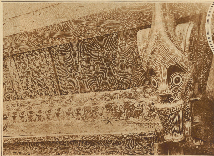
Eigenartige Schnitzereien und Malereien als Eckverzierung an einem Batak-hause in Lagoe Buti

Erwähnt sei noch das Bale, das Haus der Männer, in welchem die Beratungen abgehalten werden und das den unverheirateten Jünglingen, welche die Nacht nicht im Wohnhause zubringen dürfen, als Nachtquartier dient, wenn sie nicht bei dem Vieh oder auf dem Felde wachen müssen. Zugleich halten sich darin auch die Durchreisenden auf, wie auch ich in einem solchen Hause Quartier bezogen habe. Das Bale bildet meistens das schönste Gebäude des Dorfes und läßt durch sein Aussehen am besten auf den Wohlstand der Einwohner schließen.