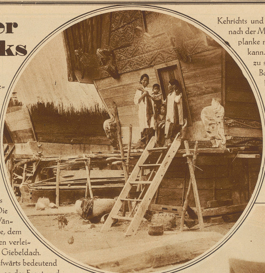
Batak-mutter mit ihren Kindern auf der Veranda ihres Hauses. Man beachte die reiche Schnitzerei am Giebel des Hauses

Form und Gestalt der Batak Häuser entspringen dem Bedürfnis der Menschen, sich vor den Unbilden des Wetters zu schützen, modifiziert durch die lokalen klimatischen Verhältnisse, die Bodenbeschaffenheit, sowie das hier zur Verfügung stehende Baumaterial. Charakter erhalten diese Gebäude durch die landesüblichen Sitten, die individuelle Auffassung und einen den Bataks angeborenen Schönheitssinn, der bei ihrem Hausbau stark zum Ausdruck kommt. Die Wohnhäuser haben eine rechteckige Basis mit einer Tiefe von 12 bis 16 m und einer Breite von 10 bis 13 m. Sie ruhen auf 3–4 m hohen kräftigen, aus dem dauerhaften Ingolholz gefertigten Holzsäulen. Die aus Brettern gefügten und nach außen geneigten Wände sind kaum 1 1/2 m hoch. Auf diesen sitzt das riesige, dem Ganzen ein ebenso originelles als typisches Aussehen verleihende, hohe, nach beiden Langseiten steil abfallende Giebeldach. Besonders charakteristisch an diesem sind die nach aufwärts bedeutend breiter werdenden Seitenteile, so daß die Firstenden an der Front und Rückseite häufig weit über die Basis des Hauses hinausragen. Der First selbst ist eingesattelt, ursprünglich wohl unabsichtlich durch das Nachgeben des nicht genügend starken Baumaterials entstanden und heute zur architektonischen Absicht geworden. / An den Firstenden sind zur