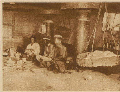
Im Innern eines Batakhauses. Beachtenswert sind die runden Scheiben zwischen den Balken, die den Ratten das Hinaufklettern unmöglich machen. Rechts hängt eine Kinderwiege an der Diele

ten hergestellte und den einzelnen Familien als Schlafstelle dienende Nischen. Von der Tür läuft gerade zur entgegengesetzten Seite eine 50 cm breite und 30 cm tiefe Rinne, die gleichsam einen Gang bildet und außerdem zur Aufnahme des