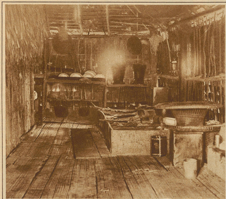
Blick in eine Batak-Küche auf Sumatra. Rechts sehen wir den großen Reisbehälter und daneben den Feuerherd

Verzierung oftmals natürliche oder in Holz geschnitzte, buntbemalte Büffelköpfe mit Hörnern oder andere hölzerne Figuren angebracht.