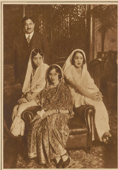
Der Maharadja von Tehri Guawall, der sich mit seinen drei Lieblingsfrauen gegenwärtig auf einer Reise durch Europa befindet