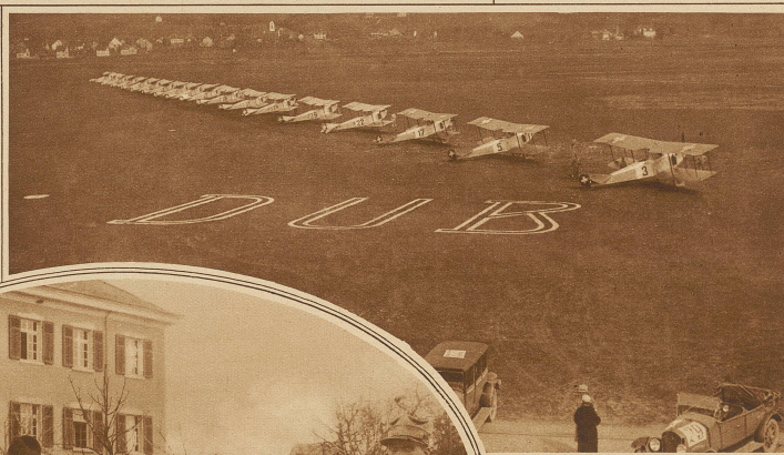
Die teilnehmenden Flugzeuge beim Start auf dem Flugplatz Dübendorf