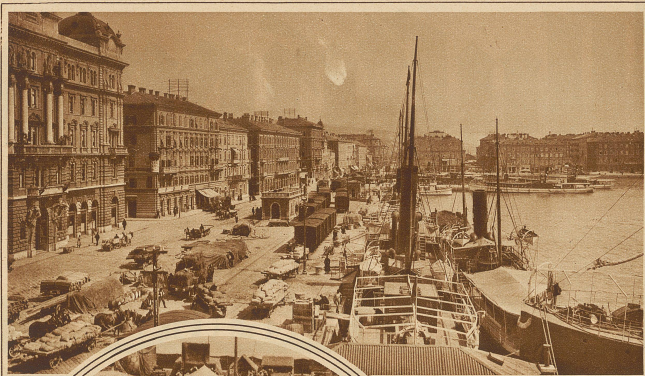
Der Hafen von Fiume, der nach dem italienisch-ungarischen Abkommen in Zukunft hauptsächlich dem ungarischen Außenhandel dienen wird