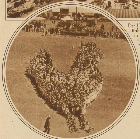
Nicht der Osterhase, sondern die Osterhase, wurde auf diese originelle Weise durch amerikanische Schulkinder zur Darstellung gebracht