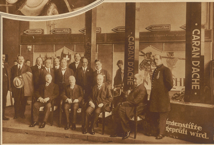
Bundespräsident Motta und Bundesrat Schulthess am offiziellen Tag der Basler Mustermesse