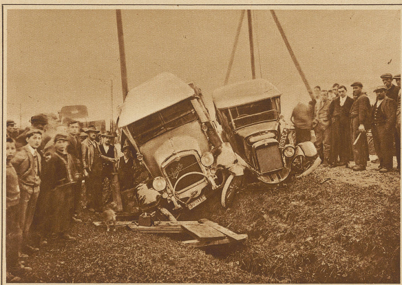
Beim Vorfahren mit geringer Geschwindigkeit fuhr auf der Zugerstrasse ein Personenwagen infolge Versagens der Steuerung seitlich in einen Saurelastwagen hinein und schob ihn seitwärts in einen Graben hinunter. Personen kamen dabei glücklicherweise keine zu Schaden