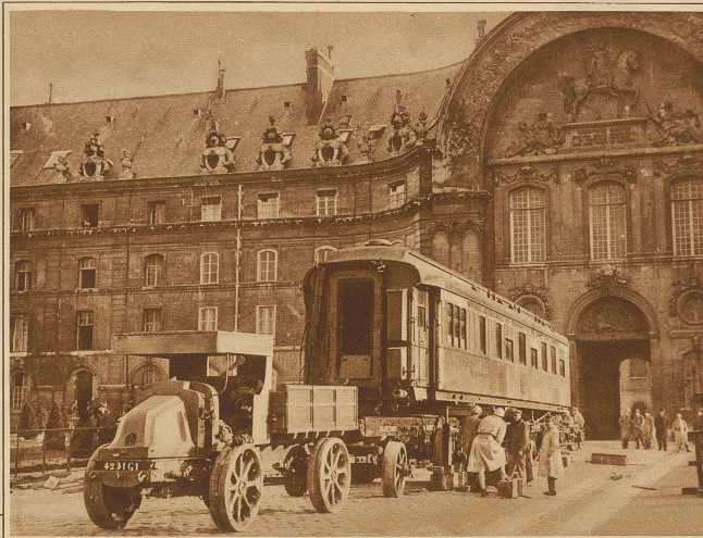
Der Salonwagen, in welchem seinerzeit der Waffenstillstand des Weltkrieges unterzeichnet wurde, wird nun aus dem Invalidendom wieder nach Reims bei Compiègne übergeführt, wo er auf der historischen Stätte aufgestellt werden soll