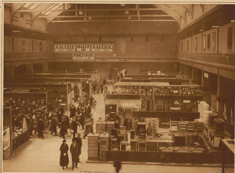
Die Halle III von den Galerien aus gesehen