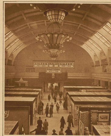
Blick in die Halle II