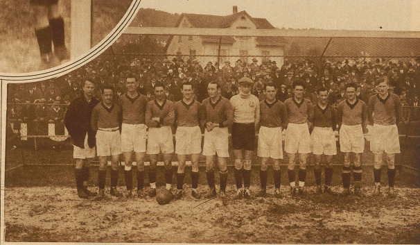
Die unterlegene Young Fellows-Mannschaft