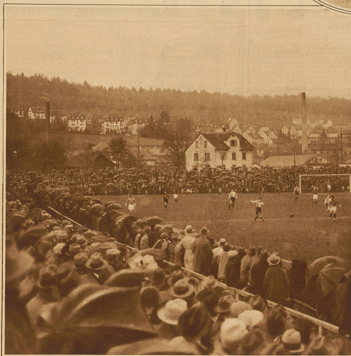
12,000 Zuschauer folgen dem Spiel mit größter Spannung