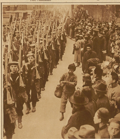
Britische Matrosen durchziehen eine der Hauptstraßen von Shanghai