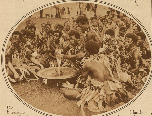
Die Eingeborenen präparieren zu Ehren des Prinzen eine Bowlie. Diese symbolische