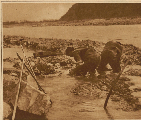
Mit Wasserhosen und Wasserstiefeln versehen, müssen die beschwerlichen Arbeiten im Wasser stehend verrichtet werden