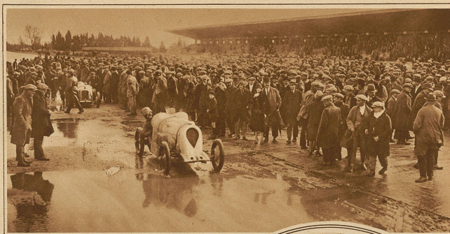
Das Publikum verhindert die Abhaltung eines Autorennens. Auf der Autokennbahn von Miramou bei Marseille sollte letzten Sonntag der Große Preis der Provence ausgetragen werden. Des schlechten Wetters und der gefährlichen Piste wegen erschienen nur 2 Wagen am Start und das Publikum, das sich so um die erwarteten großen Sensationen betrogen sah, drängte nach der ersten Runde in die Bahn ein und verhinderte die Weiterfahrt.