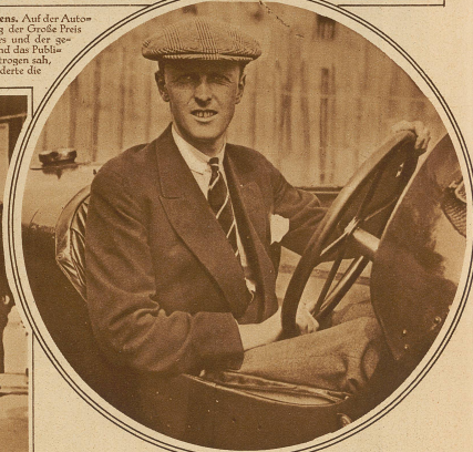
Major Seagrave, der bekannte englische Rennfahrer, erreichte am Dienstag auf der Piste von Dayton (Florida) mit seinem 1000-ferdigen Wagen eine Geschwindigkeit von 327 km in der Stunde