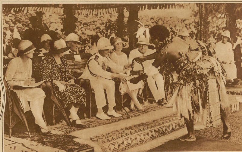
Besuch des Prinzen von York auf den Südseeinseln

Ratu Popi Semiloli, der Großsohn des letzten Königs der Südsee, überreicht dem Prinzen als Zeichen der Ergebenheit einen Wallisesschuh