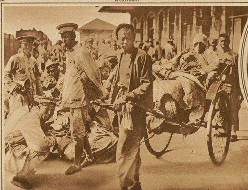
Verwundetentransport im Bahnhof von Shanghai