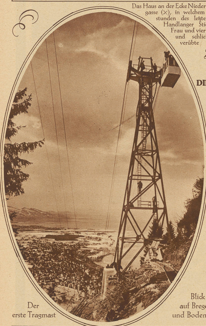
Der erste Tragmast

Diese erste Seilschwebbahn im Bodenseegebiet führt von Bregenz auf die 1040 m hohe Pfänderspitz