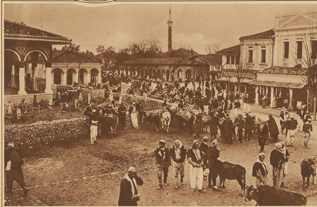
Auf dem Hauptplatz in Tirana, der meistgenannten Stadt Albaniens