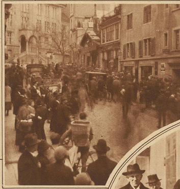
Die sensationslustige Menge wartet auf nähere Einzelheiten