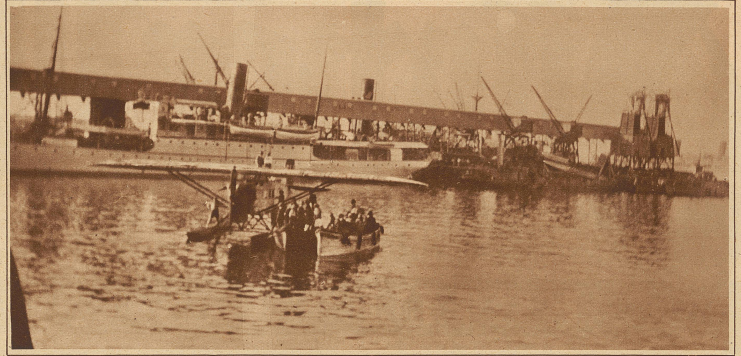
Mittelholzer am Ziel. Mit dem gleichen Schiff, das Mittelholzer wieder in die Heimat zurückbrachte, gingen uns von einer eifrigen Leserin diese beiden Aufnahmen aus Kapstadt zu, die seine dortige Landung und die Einbringung der «Switzerland» in den Hafen im Bilde festhalten