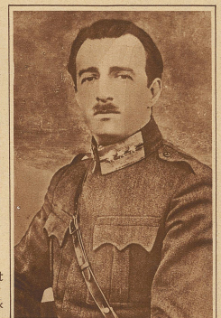
Rechts: Ahmed Bey Zogu, der streitbare Präsident der albanischen Republik