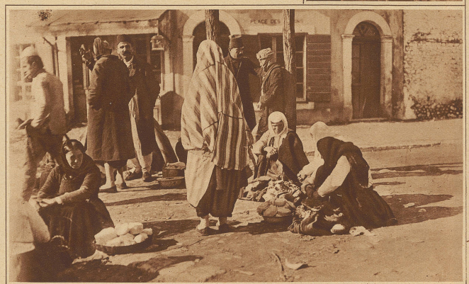
Szene auf dem Markt in Tirana