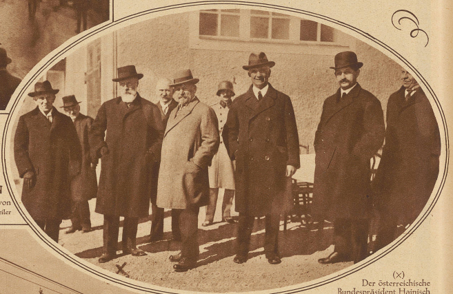
(X) Der österreichische Bundespräsident Hainisch an der Einweihungsfeier