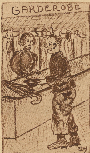
Garderobière: «As Operaglas glällig?» Bauer: «Nä, i män, i stufs gad us dr Flasche.»

Geschäftsbrief. «Ich bestätige Ihnen den Empfang von tausend Franken. Drei Scheine à hundert Franken waren falsch. Diesmal gelang es mir noch, dieselben unterzubringen.»